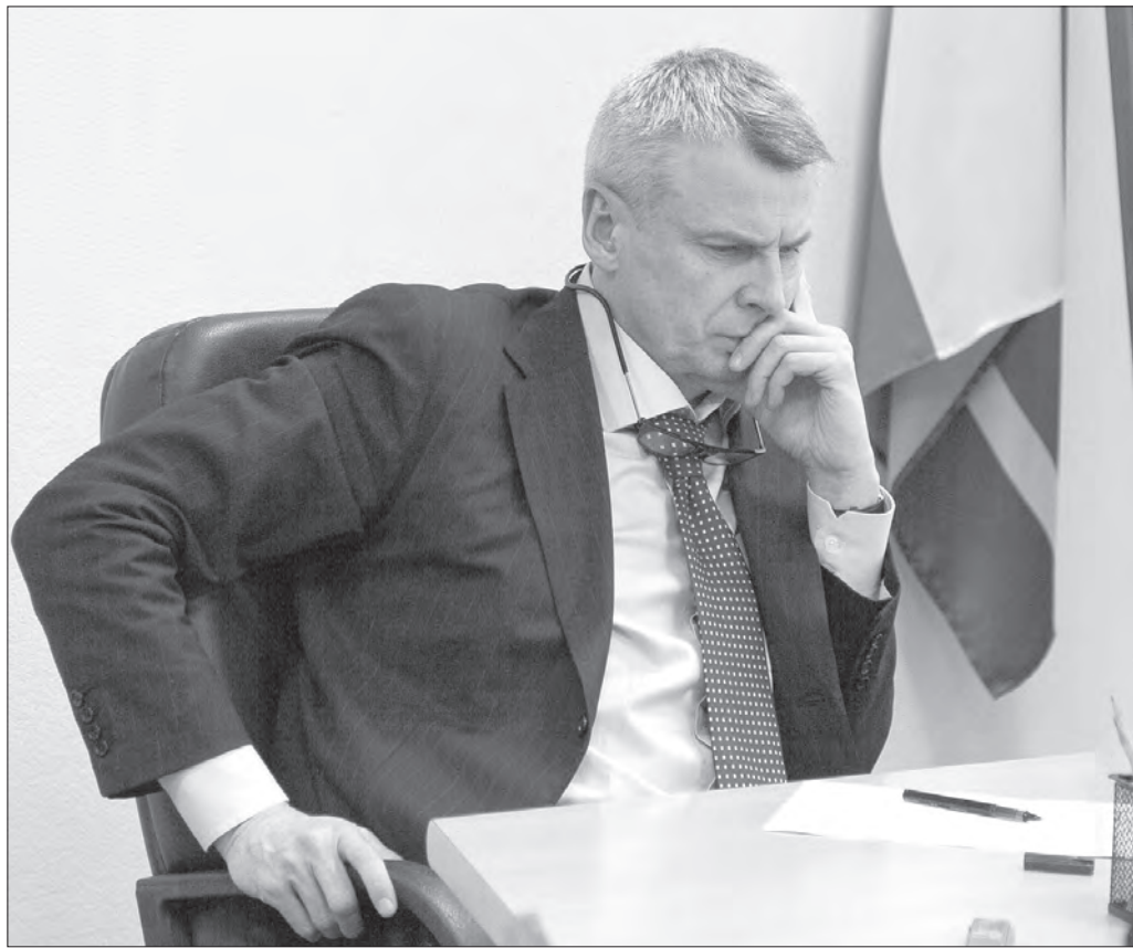
Глава города Сергей Носов.