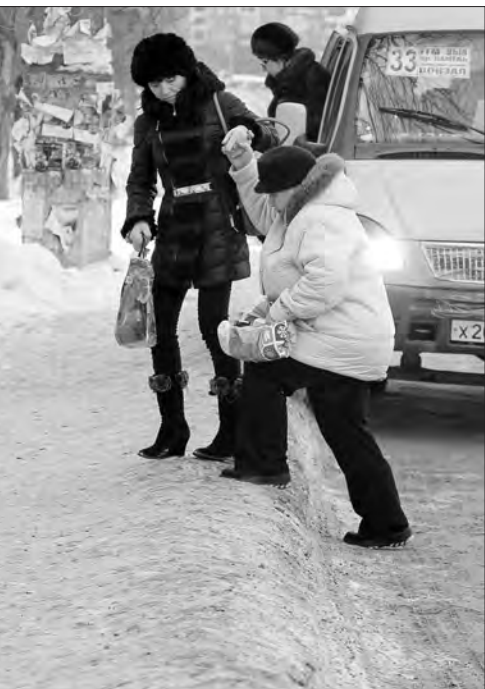
Трудно, хоть и помогают.