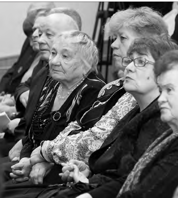
Участники заседания совета ветеранов.

Остро обозначилась в последнее время проблема определения юридического статуса ветеранов, являющихся фактически «деть-