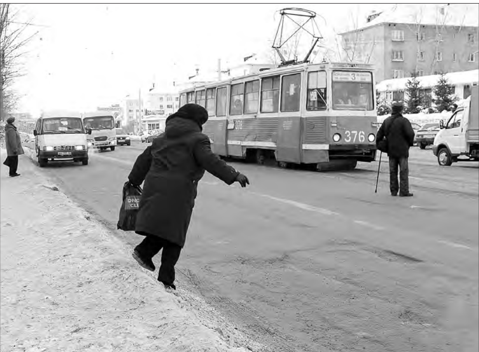
Успеть бы на трамвай и уцелеть!