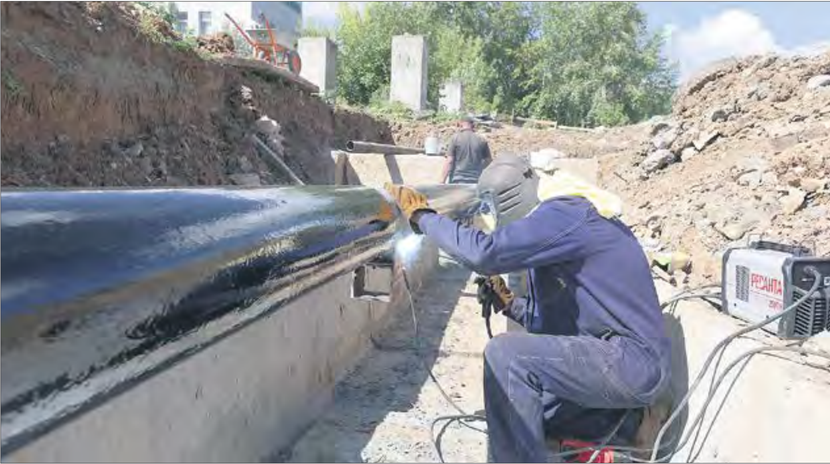
Чтобы приступить к капитальному строительству, надо поменять все трубы на участке.