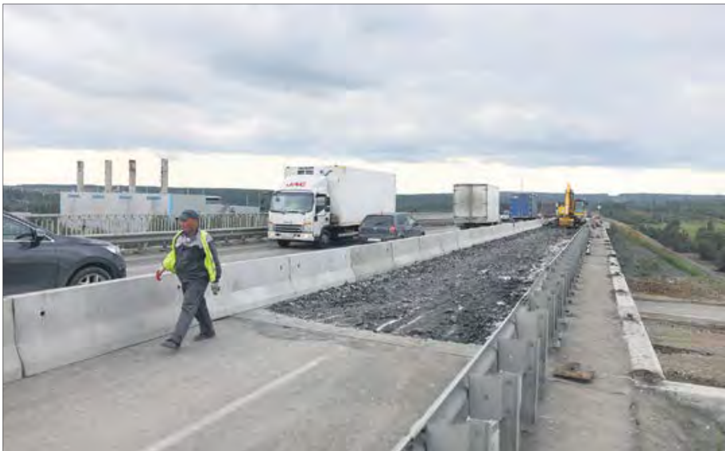
На мосту над СУМЗовской дорогой закрыли одну часть для движения. Сначала сделают и расширят ее, а потом пустят поток по отремонтированной части и возьмутся за старую.

Ремонтируемый участок моста (тот, что справа, если смотреть в сторону Перми) закрыли бетонными блоками. Буквально за один-два дня рабочие сняли весь старый асфальт. Скоро начнется демонтаж балок. Поставят новые, более широкие. Параллельно начнут возводить новые опоры. Был у нас мост шестипролетный, а сделают в итоге четыре пролета. Из-за новых балок проезжая часть поднимется примерно на метр. Потом там сделают асфальт и переключатся на левую часть, пустив движение по новенькому мосту.