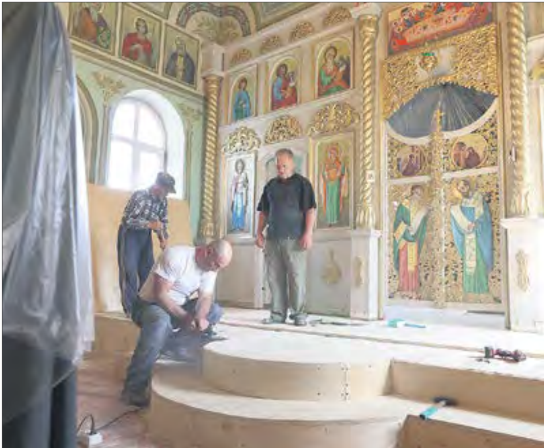
Строительная бригада из поселка Верхние Серги работает быстро и слаженно.

И Чеховский сквер — я так переживаю за него. Чтоб люди сохранили это все. И красивые лавки, и все остальное. Я бы очень хотел, чтоб это сберегли. Когда хожу по вечерам гулять пешком, люблю за всем наблюдать. Порой иду и люблю, и Ревда меня радует. Поначалу думал, как же я тут буду после Екатеринбурга? А, оказалось, что прекрасно, и даже скучать некогда. Думал, может вот сегодня поскучать, но вот вы приехали, и опять не до скуки. Сейчас поеду в Екатеринбург в Епархию по делам. Да, по дороге пробки, а зато потом будет лучше, когда дорогу расширят, это для нас же стараются. Лишь бы люди учились беречь всё, что для них другими людьми делается.