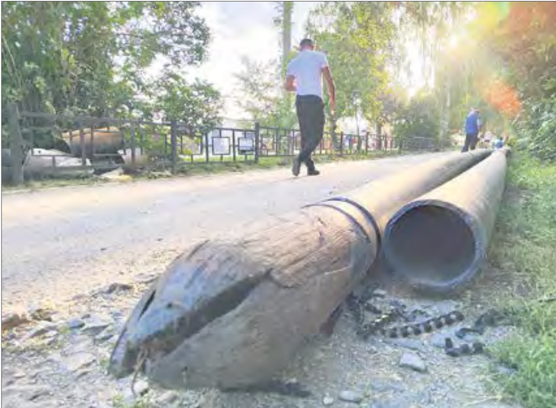
На Российской приступили к замене магистрального водопровода. Новые трубы уже готовы.

В Ревде начался масштабный проект по модернизации сетей водоснабжения. В рамках его отремонтируют 8 км труб, на это потратят более 58 млн рублей. Работы уже начались. Часть из них проведут в следующем году.