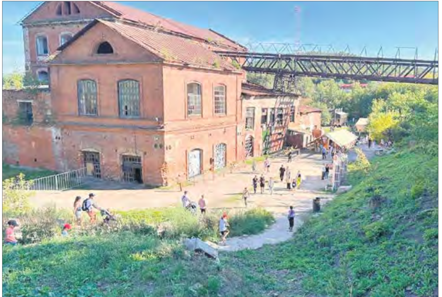
«Лето на заводе» расположилось в живописном месте, под боком плотины Сысертского водохранилища.

Сам завод расположен в очень живописном месте. Прямо под боком плотины Сысертского водохранилища. В глубокой ложбине стоят старые цеха,