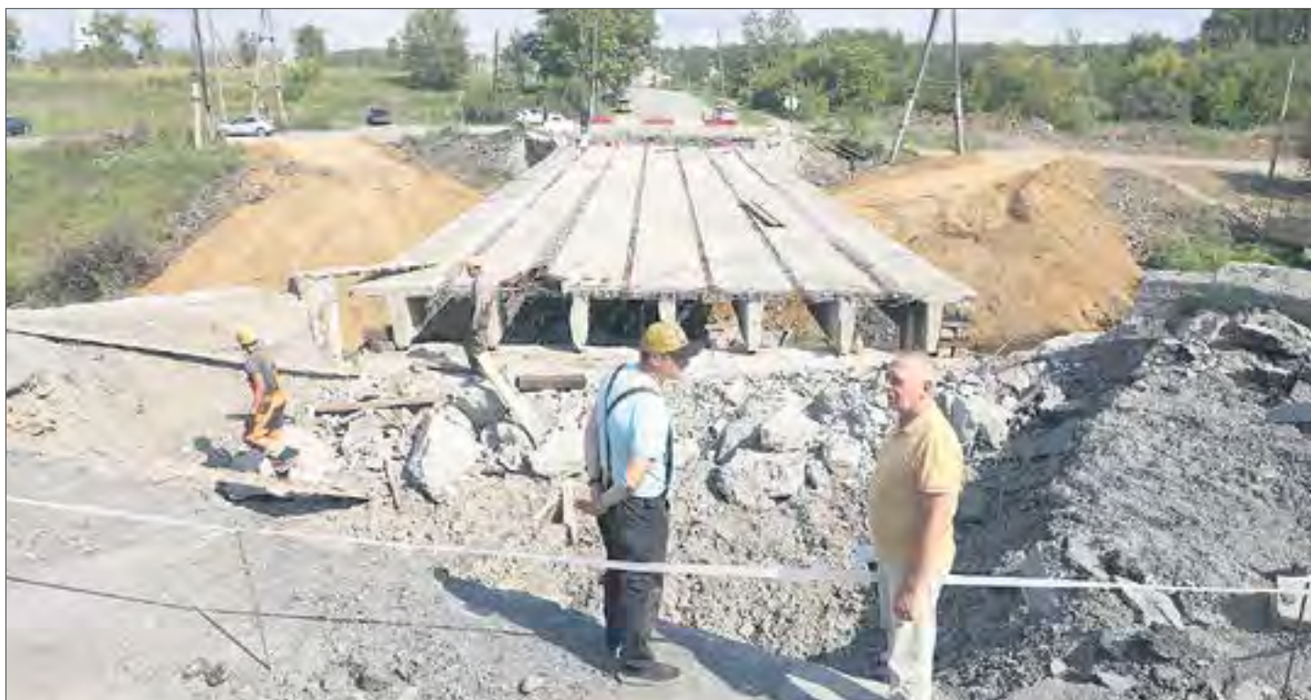
Шараминский мост полностью «оголили» от асфальта и шкафной стенки. Теперь хорошо видно, в каком состоянии перекрытия и опоры, и что нужно ремонтировать.

Строителям пришлось заузить русло реки Ревды, это предусмотрено проектом. С обеих сторон отсыпается площадка для строительной техники. Скоро в реку положат водопропускные трубы и отсыпят дорогу до противоположного берега. После окончания работ русло реки восстановят и проведут благоустройство.