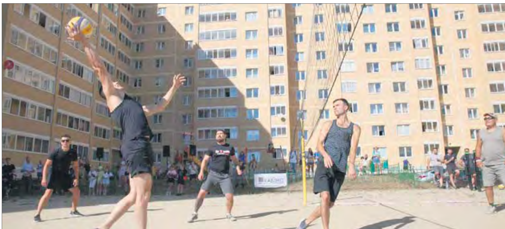
В прошлом году из соревнований получился настоящий спортивный праздник двора. Присоединяйтесь!