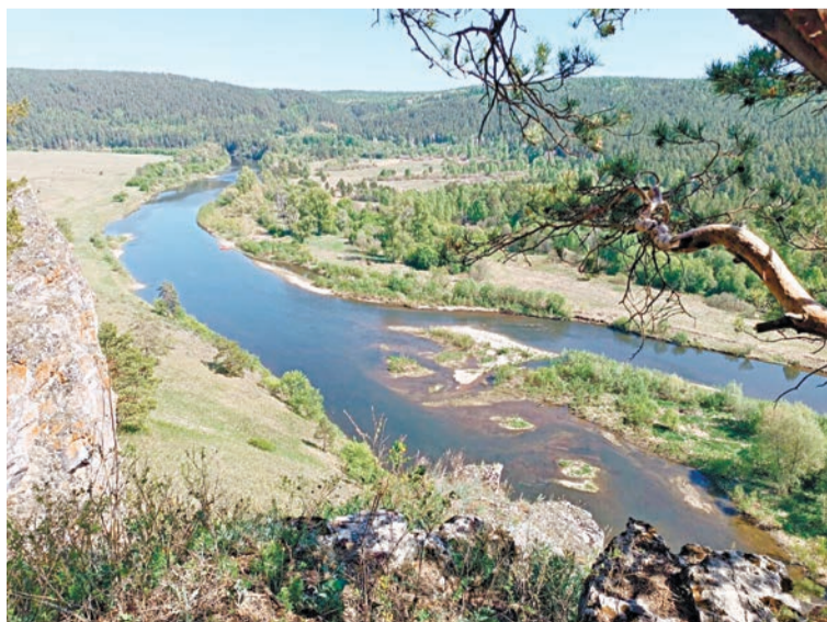
Одна из красивейших рек Южного Урала — Юрюзань