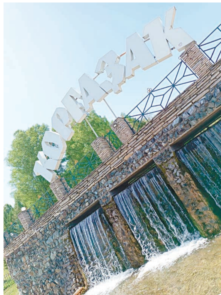
Живая вода источника Кургазак

Кстати, Идрисовская пещера знаменита тем, что, согласно преданию, в ней прятался Салават Юлаев со