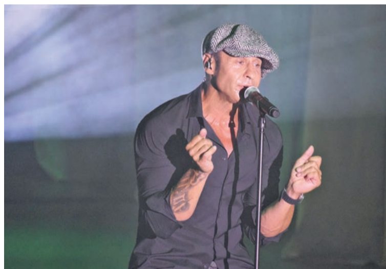
На сцене Дворца культуры для работников ГОКа спел Стас Костюшкин