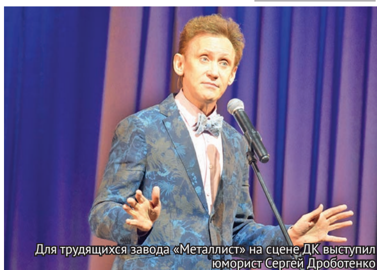
Для трудящихся завода «Металлист» на сцене ДК выступил юморист Сергей Дроботенко