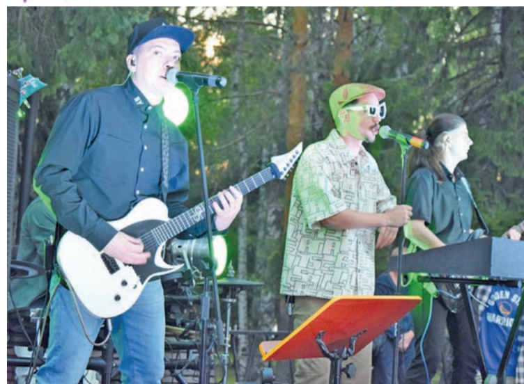
На «Сковородке» прошла ретро-программа «По волнам нашей памяти» и выступление кавер-группы «Potracheho»