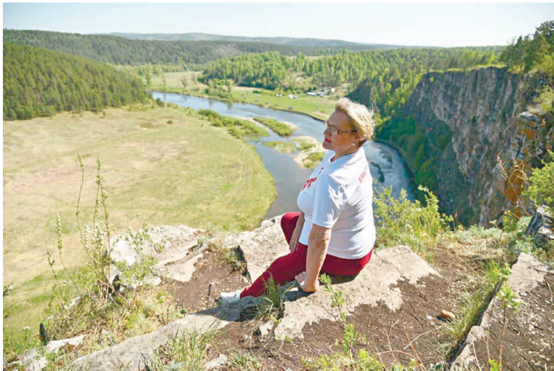
В городе такую красоту не увидишь!

Пещера-дворец — так называют здесь в Башкирии Идрисовскую пещеру. Известна больше, как пещера Салавата Юлаева. Это самая доступная пещера, подняться сюда без какой-либо подготовки может любой желающий.