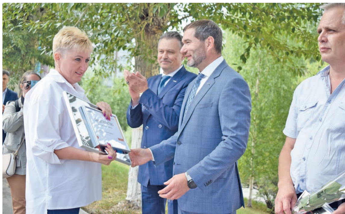
Награждение работников комбината, чьи фото теперь размещены на Аллее славы по Свердлова