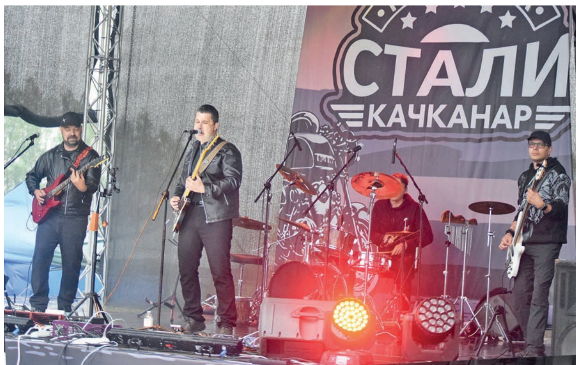
Мотофестиваль «Музыка стали» завершил череду мероприятий