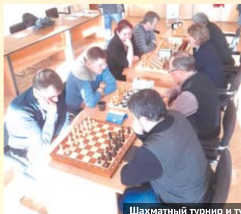
Шахматный турнир и туристический слет работников «Огнеупоров».