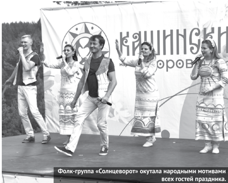
Фolk-группа «Солнцеворот» окупала народными мотивами всех гостей праздника.

В минувшую субботу, 8 июля, в городском округе Богданович прошло XX Областное Народное гуляние «Кашинский хоровод». Мероприятие было посвящено Всероссийскому дню семьи, любви и верности. Юбилейный фестиваль возле деревни Кашина собрал более 500 участников из 15 муниципальных образований Свердловской области, Челябинской и Курганской областей, а также более пяти тысяч гостей