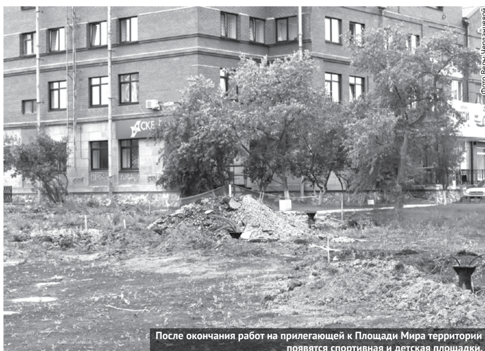
После окончания работ на прилегающей к Площади Мира территории появятся спортивная и детская площадки.

Общественная комиссия подвела итоги общественного обсуждения проекта муниципальной программы «Формирование современной городской среды на территории городского округа Богданович на 2018-2027 годы»