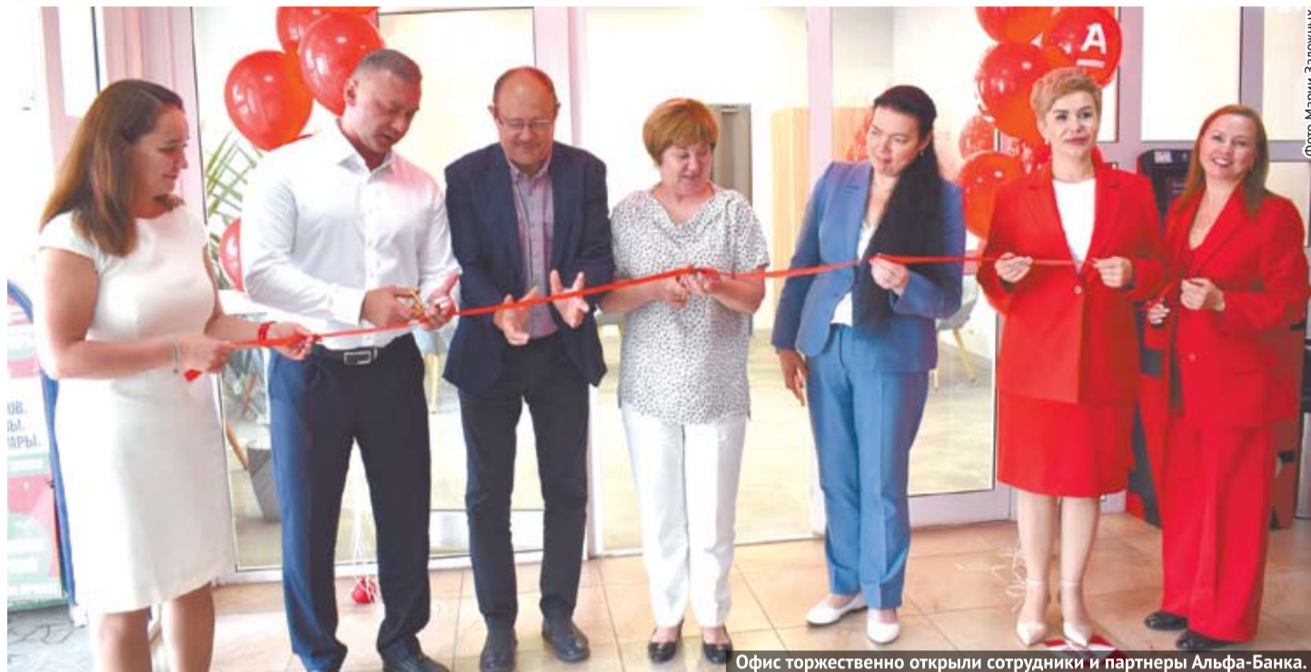
Офис торжественно открыли сотрудники и партнеры Альфа-Банка.

В Свердловской области Альфа-Банк работает 24 года. Им обслуживается 380 тысяч физических лиц и 34 с половиной тысячи юридических. Сегодня Альфа-Банк занимает второе место в регионе по работе с юристами. Это стабильный банк, которому смело могут доверить свои денежные средства жители Богдановича.