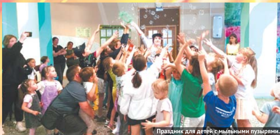
Праздник для детей с мыльными пузырями.

Оксана Леонидовна отметила, что текущий год богат на юбилейные события и даты: