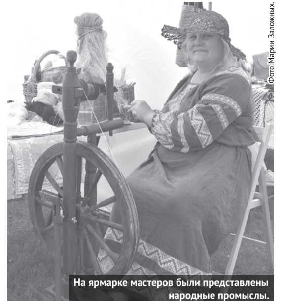
На ярмарке мастеров были представлены народные промыслы.