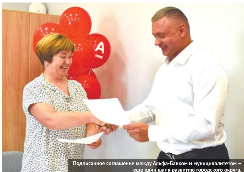
Подписанное соглашение между Альфа-Банком и муниципалитетом – еще один шаг к развитию городского округа.