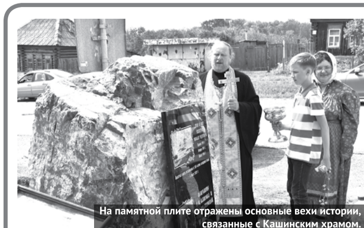
На памятной плите отражены основные вехи истории, связанные с Кашинским храмом.