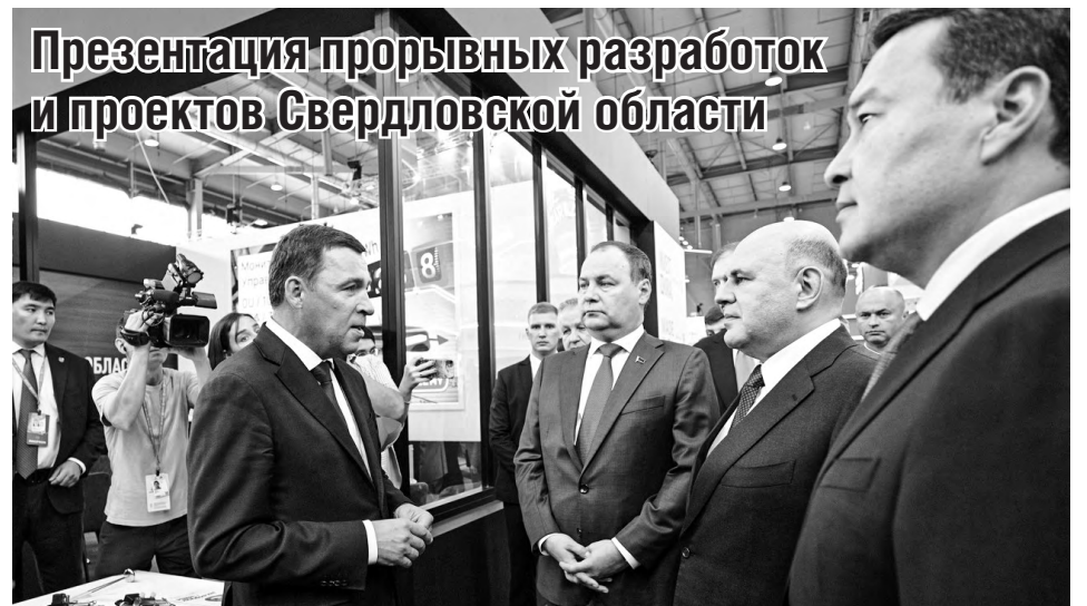
Губернатор Евгений Куйвашев 10 июля представил председателю Правительства РФ Михаилу Мишустину, премьер-министру Республики Беларусь Александру Головченко и главе Правительства Республики Казахстан Алихану Смаилову прорывные разработки уральских предприятий, презентованные на стенде Свердловской области в рамках международной промышленной выставки ИННОПРОМ – 2023.