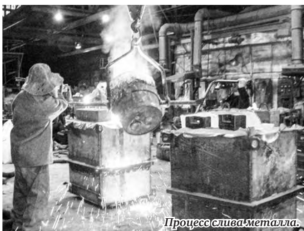
Процесс слива металла.