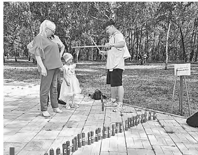
Участники семейной игры на этапе «Ловись, рыбка»

Поиграть решились 23 семейные команды, 11 из них