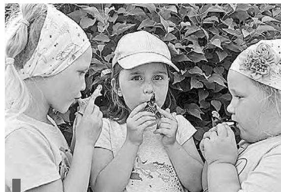
Засvistели игрушки на разные лады