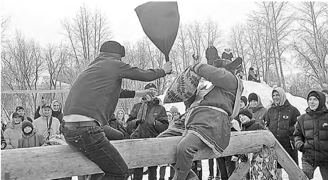
Народные забавы на широкой Масленице