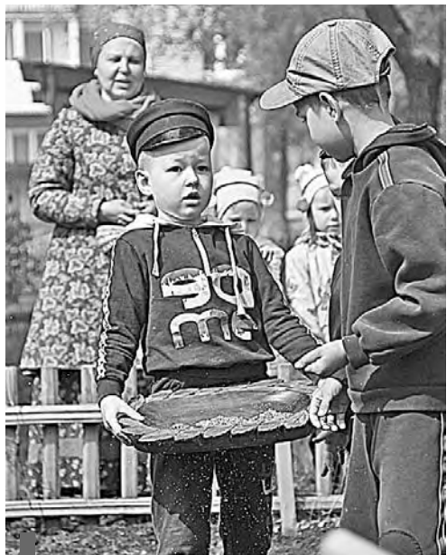
Сеять лен доверили самым маленьким