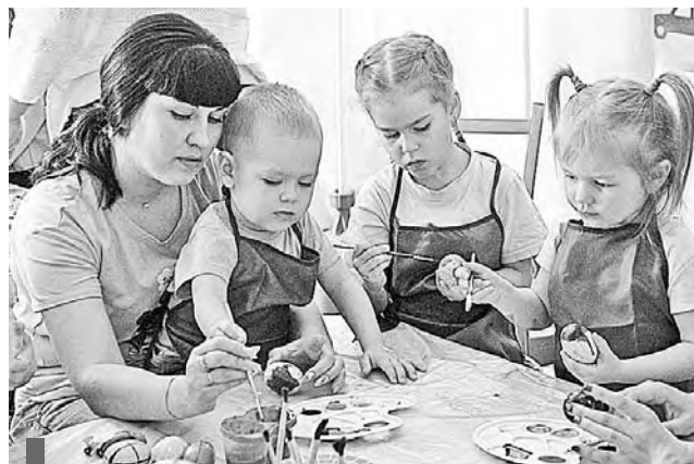
Роспись пасхальных яиц