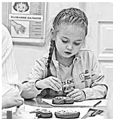
А сверху пряника – глазурь