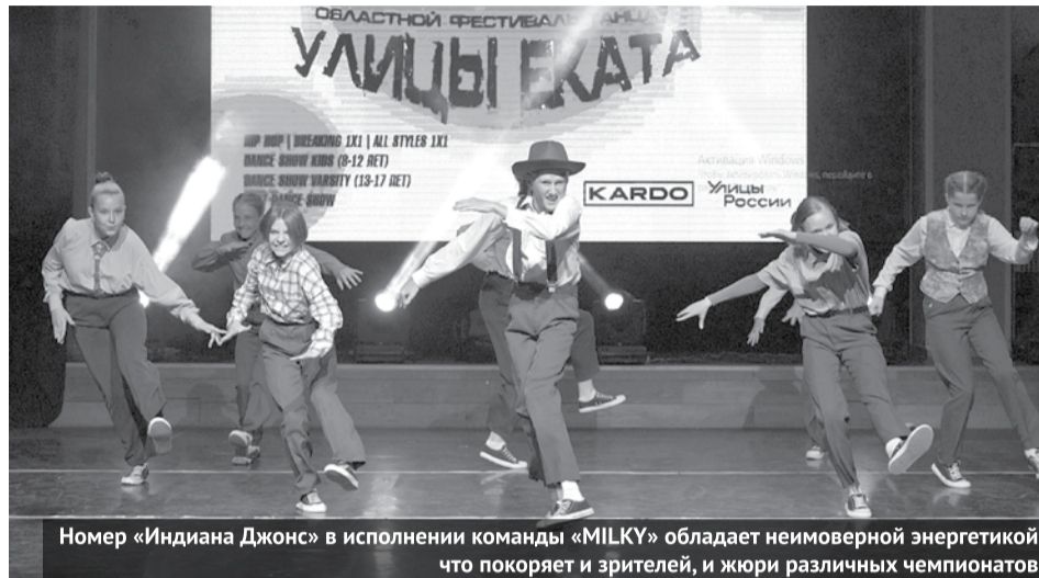
Номер «Индиана Джонс» в исполнении команды «MILKY» обладает невероятной энергетикой, что покоряет и зрителей, и жюри различных чемпионатов.