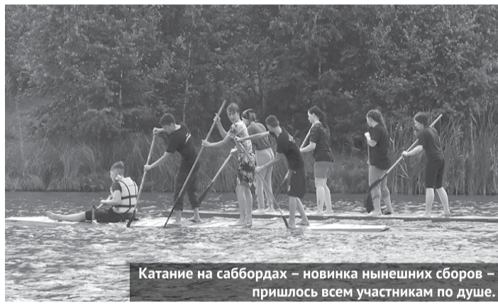
Катание на саббордах - новинка нынешних сборов - пришлось всем участникам по душе.

Любо, братцы, любо... Любо, братцы, жить... эх... А у нас в «Дозоре» не приходится тужить.