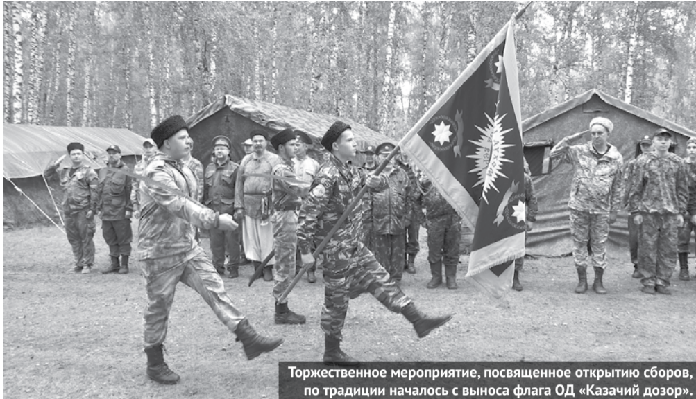
Торжественное мероприятие, посвященное открытию сборов, по традиции началось с выноса флага ОД «Казачий дозор».

В Богдановиче завершились итоговые сборы пикетов общественного движения «Казачий дозор». С 16 по 23 июля воспитанники движения жили, учились, тренировались и отдыхали в полевых условиях на территории спортивной базы «Березка»