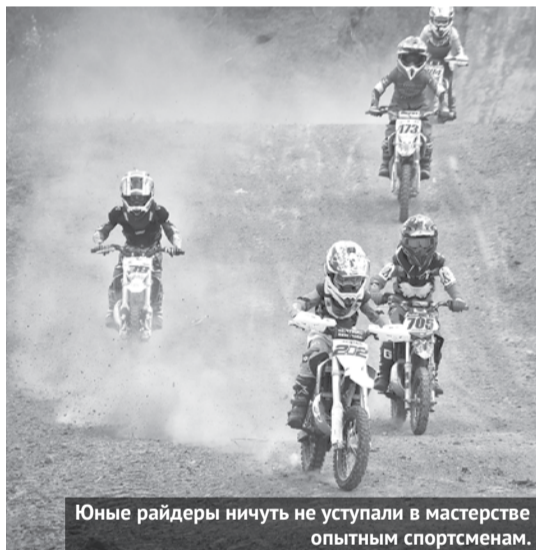
Юные райдеры ничуть не уступали в мастерстве опытным спортсменам.

Жаркие заезды в минувшую субботу устроили лучшие мотогонщики из Свердловской, Тюменской, Курганской и Челябинской областей, ХМАО и ЯМАО на Коменской трассе, где проходил фестиваль технических видов спорта, посвященный Дню физкультурника. Шесть часов подряд участники буквально сквозь песок и грязь взлетали над головами зрителей