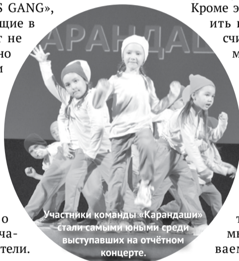
Участники команды «Карандаши» стали самыми юными среди выступавших на отчетном концерте.

К большому танцевальному движению вместе со студией уличного танца «Harlem» могут присоединиться все желающие. С 1 августа будет объявлен набор в новые группы, самая младшая из которых – baby class – с четырех лет. Узнать подробнее можно по телефону – 8-963-037-64-70 (Евгения Валентиновна). Также вся информация публикуется в группе студии в социальной сети в «ВКонтакте» (vk.com/harlemnds).