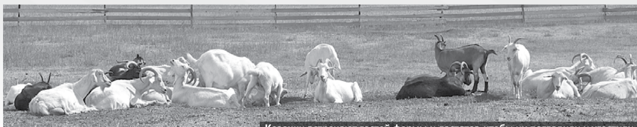
Козочки встречают гостей фермы и ластятся, чтобы их погладили и угостили.