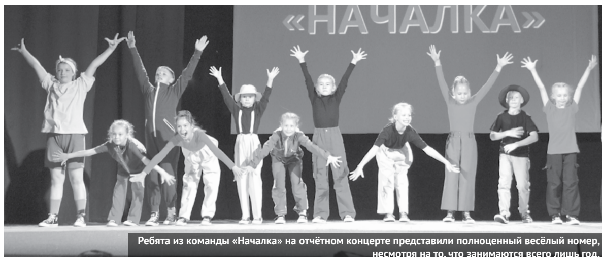
Ребята из команды «Началка» на отчетном концерте представили полноценный веселый номер, несмотря на то, что занимаются всего лишь год.