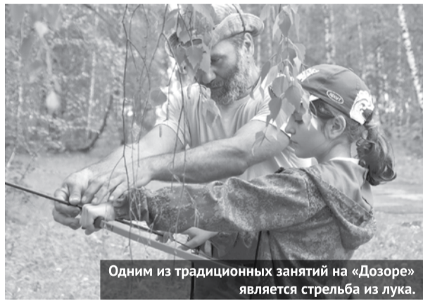
Одним из традиционных занятий на «Дозоре» является стрельба из лука.