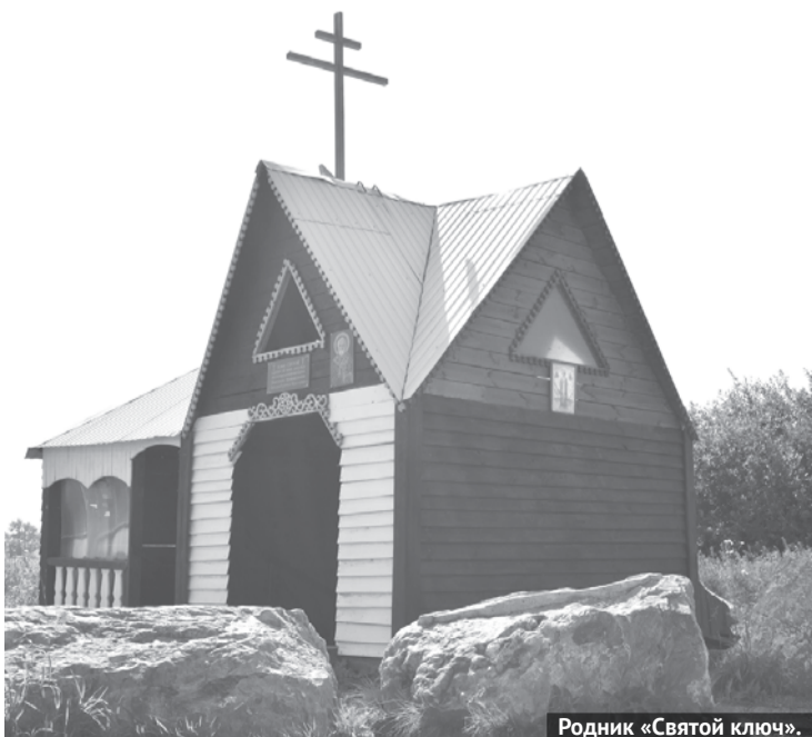
Родник «Святой ключ».

Поразительны красотой леса и поля Чернокоровские. Знаменита территория Паршинским прудом и рыбопитомником, куда ездят, чтобы отдохнуть от городской суеты. Большую значимость имеет родник «Святой ключ». Даже из далёких районов приезжают сюда за кристальной и целебной водой. Рассказы о чудесных свойствах родниковой воды передаются местными жителями из поколения в поколение. Популярное место – ферма «Долина коз». Здесь можно приобрести вкусный козий сыр, творог, сливки, сгущёнку и молоко, а также сходить на экскурсию по фермерскому хозяйству в сопровождении гида, продегустировать продукцию, поучаствовать в мастер-классе по дойке козы, посетить сыроварню, прогуляться к волшебному дереву исполнения желаний.