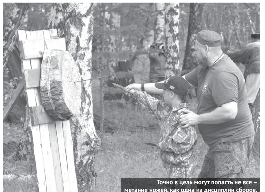
Точно в цель могут попасть не все - метание ножей, как одна из дисциплин сборов.