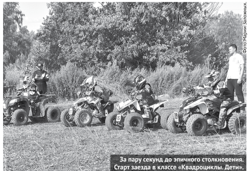
За пару секунд до эпичного столкновения. Старт заезда в классе «Квадроциклы. Дети».