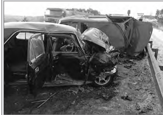
* «Рено» после столкновения с «Волгой».