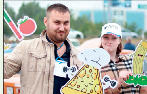
На «УралМосквичфесте» волонтеры сопровождают участников авоковеста

Лето – прекрасная пора возможностей. Казалось бы. Но возникает парадокс. Если есть множество свободного времени, выясняется, что заняться чем-то классным и правильным по сути-то и нечем. Сидеть до бесконечности за компьютером, особенно если родители не дома, вариант для подростка далеко не лучший. Как можно круто и незабываемо провести под-ростку лето?