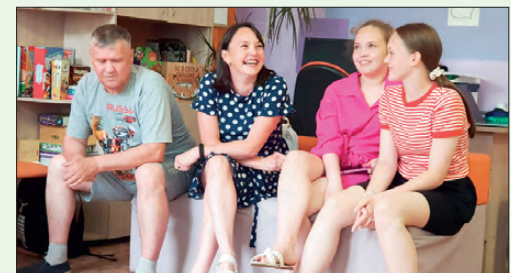
На игре – интеллектуалочке к Дню семьи, любви и верности

По-особенному отметили в Центре День семьи, любви и верности. Хотя исторически праздник приурочен к православному дню памяти святых Петра и Февронии, а здесь решили связать этот день с Центром, потому что «Центр по работе с молодежью» - это большая семья, в которой насчитывается более 200 волонтеров от 12 до 35 лет. Пригласили семьи волонтеров и поиграли в игру - интеллектуалочку, познакомились, развлеклись и отдохнули. Получилось здорово, уютно и атмосферно.