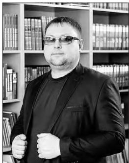
Евгеньевич работает 5 лет.

«Моя работа в УИК началась в 2018 г., тогда я стал членом комиссии. На