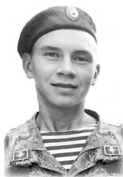
Родные и близкие

21 июля исполняется 9 дней, как не стало с нами нашей любимой