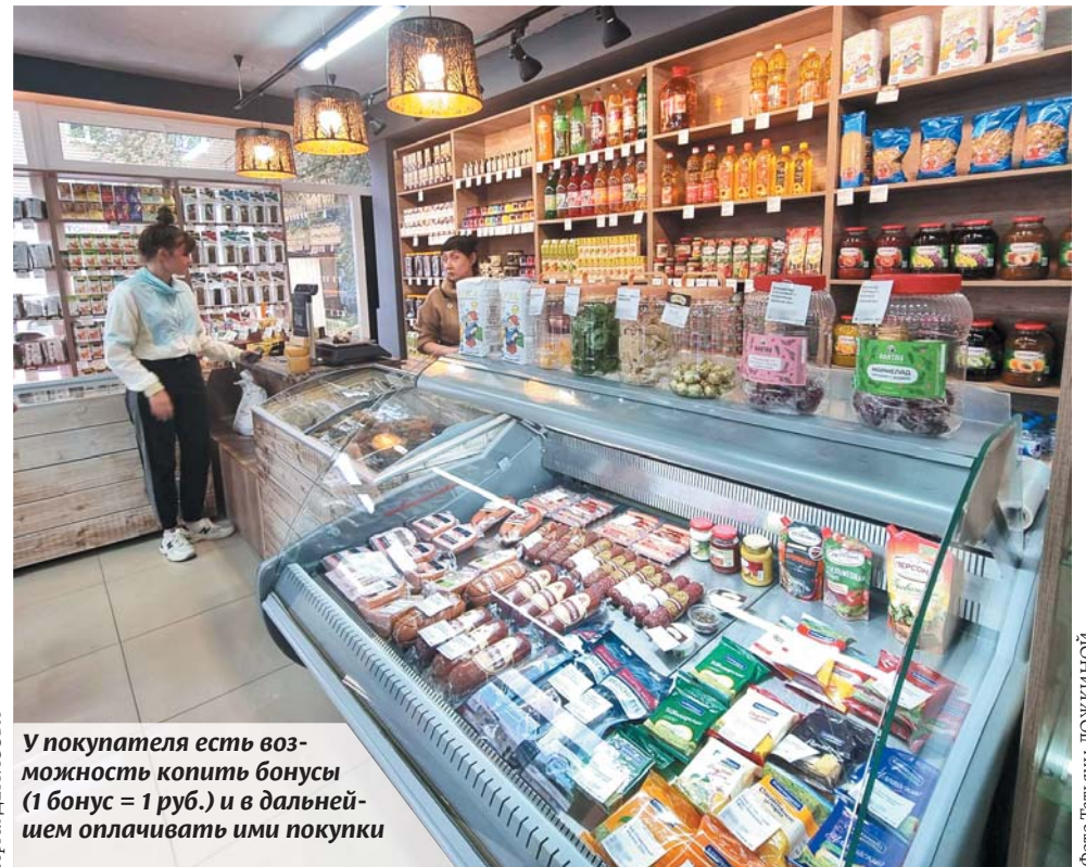
У покупателя есть возможность копить бонусы (1 бонус = 1 руб.) и в дальнейшем оплачивать ими покупки

Кто, если не мы, взрослые, расскажем детям, что