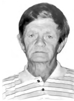
Родные и близкие

Идут года, за годом год, И этот год в былое канет, Лишь память вечна, не умрет, И в ней ты здесь, ты рядом с нами. Светлая память и вечный покой.