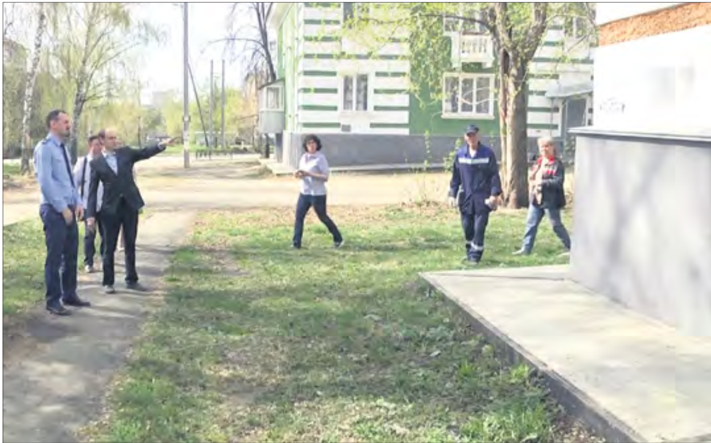
Одно из направлений муниципального контроля в сфере благоустройства — ликвидация надписей на фасадах зданий. Не все управляющие компании считают своей обязанностью убирать «курехи» с домов.