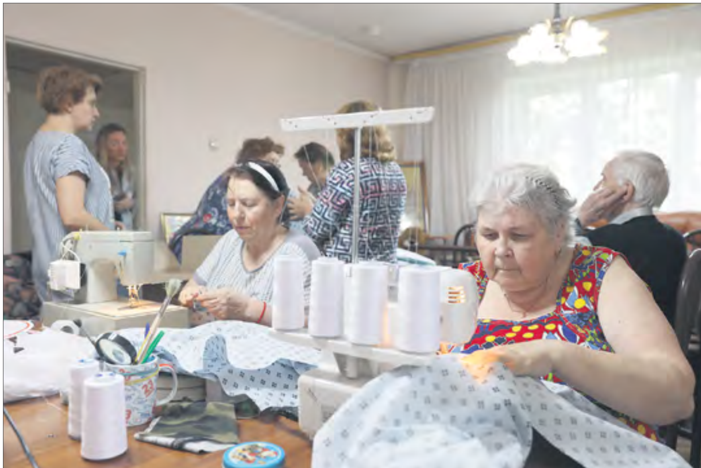
Работа кипит — женщины собирают посылку для госпиталя.

Дом ветеранов смог выделить для них это помещение. И вот уже два месяца они приходят и работают здесь каждый день с 10 до 17.