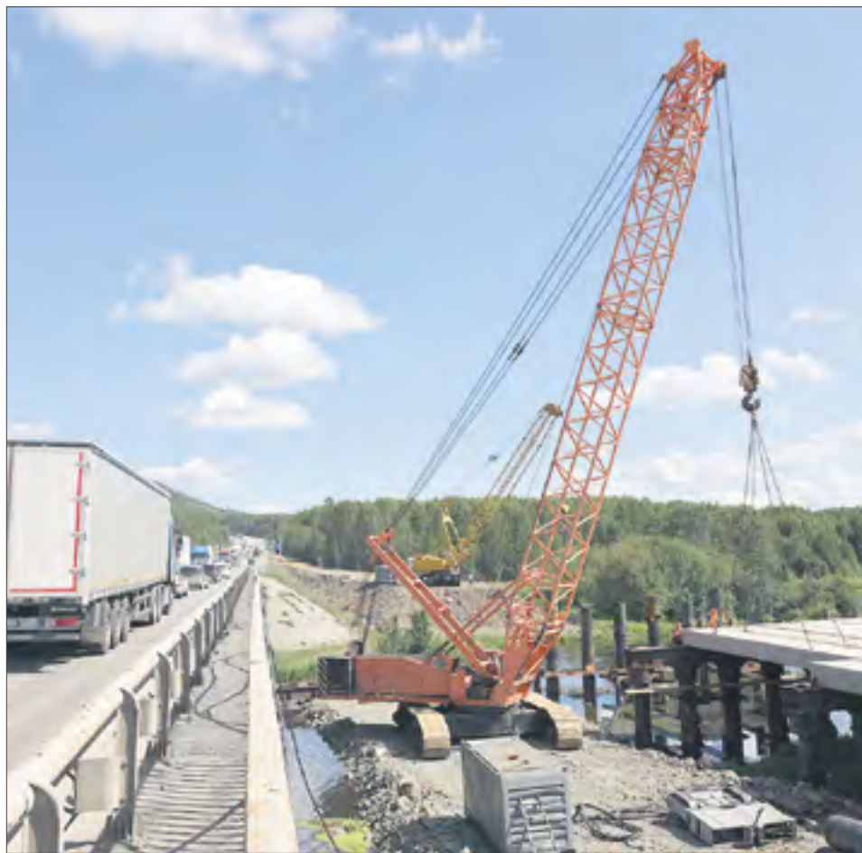
Справа от моста через Чусовую строят временный объезд. Около года транспортный поток будет идти здесь.