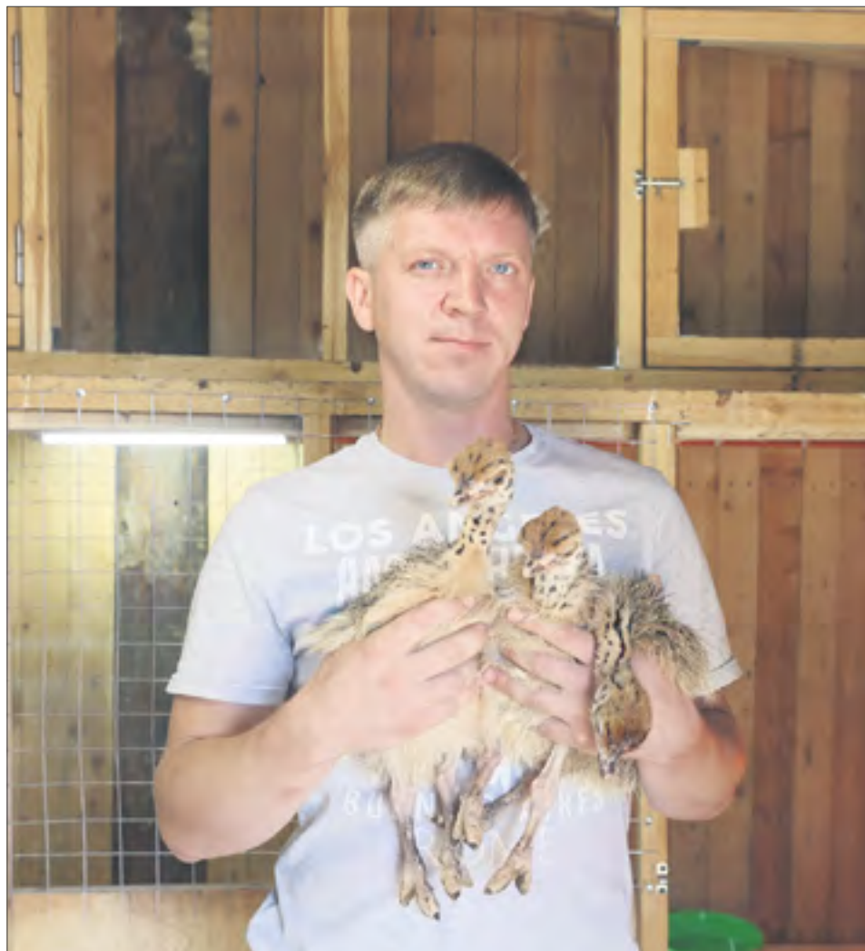
Вот такие милахи вылупились в страусином хозяйстве семьи Медведевых.

Этих малышей Константин планирует оставить себе, говорит, что страуса можно сделать ручным, и он хотел бы попробовать. Но приучить к рукам можно только самку. А пол, как мы уже знаем, определяется только в год.