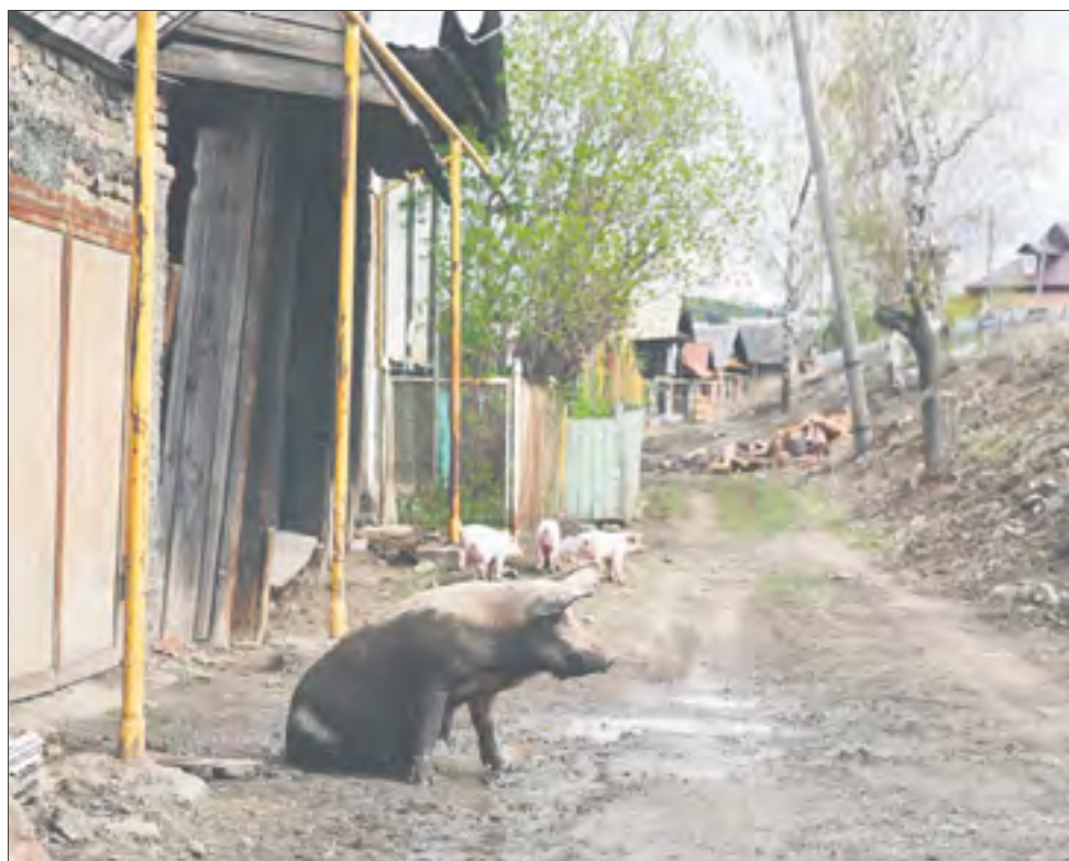
Пока проблему бродячих, непривитых и, возможно, больных животных Ташкента не может решить никто. Посмотрим, что получится у прокуратуры.