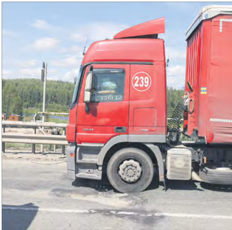
Те самые швы, из-за которых и образовывается пробка. Фуры проезжают их со скоростью пешехода.