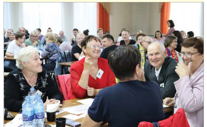
Ветераны много знают о кино.