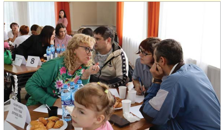
«Хорошо, что мы пришли» (МЛЦ).