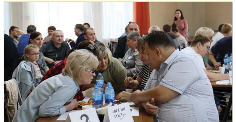
В команде ЦЗЛ – «Всё по ГОСТу».