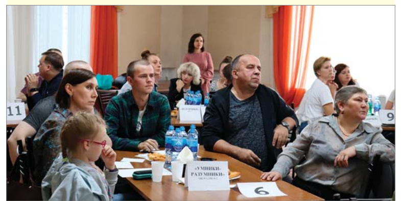
Сборная огнеупорных цехов.