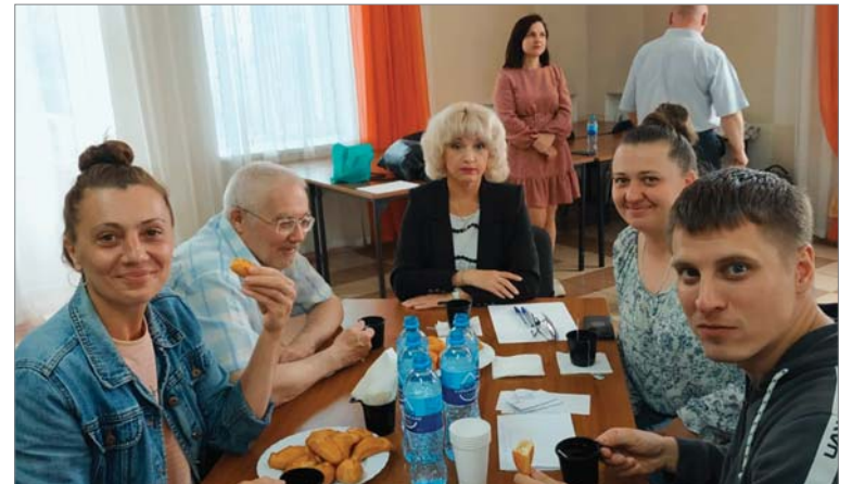
«Везунчики» стали победителями.

«Приятно было сегодня видеть полный зал. Хотелось, чтобы заводчане смогли интересно провести время в этот вечер, неформально пообщаться друг с другом. Рады, что получилось. Областная «Профсоюзная Мозголомка» на предприятиях ГМПР проводится шестой год, но мы решили в этот раз не включать вопросы о профсоюзе, выбрали тему, близкую всем. Есть идея провести следующую игру к Дню матери и посвятить её женщинам, мамам».