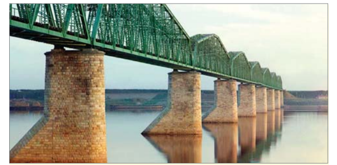
Железнодорожный мост через Каму в Перми. 1910 г.

По решению Императора Николая II для растущих потребностей Дальнего Востока в 1908-1916 годах была построена Амурская железная дорога, которая проходила по районам, еще почти не заселенным.