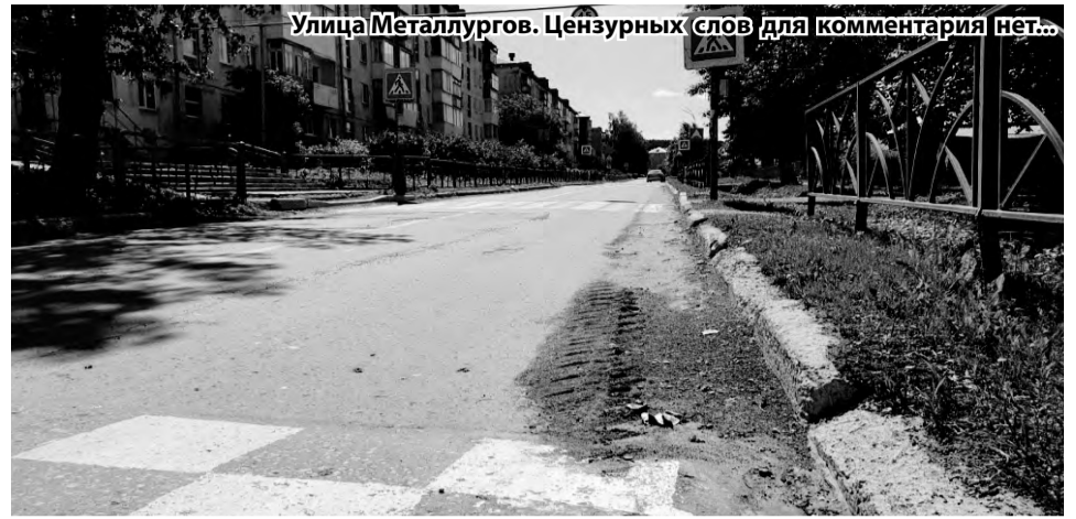
Улица Metallургов. Цензурных слов для комментария нет...