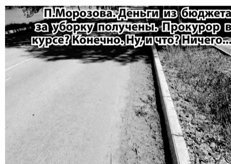
П.Морозова. Деньги из бюджета за уборку получены. Прокурор в курсе? Конечно. Ну, и что? Ничего...

Следствием установлено, что подписи и печать ООО «Горизонт» не принадлежат