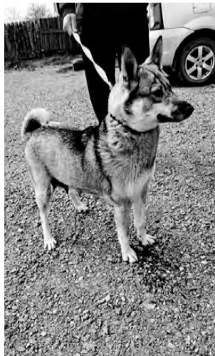
БЕЛА. Небольшая лаечка, добрая, умная, послушная