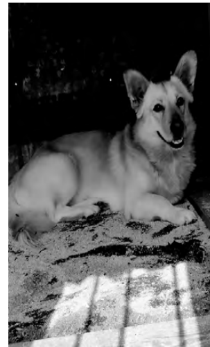
ГОША. Толстяк на коротких лапках, можно в квартиру, можно во двор