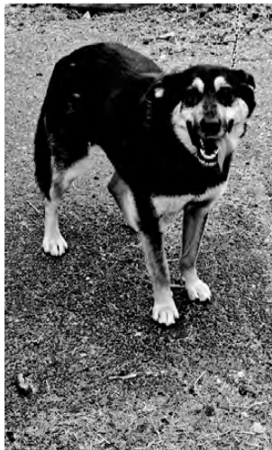
МУХА. Весёлая, послушная, приучена к цепи и вольеру