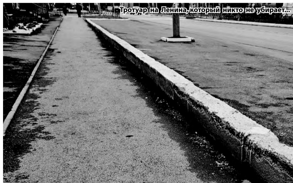
Тротуар на Ленина, который никто не убирает...

Связь между пылью улиц и заболеваниями, причем не только лёгких и аллергий, но и многих других, очевидна. Как очевидна связь между коррупцией, разворовыванием бюджета со всем с этим: с грязью и пылью улиц и общей неустроенностью городского быта.