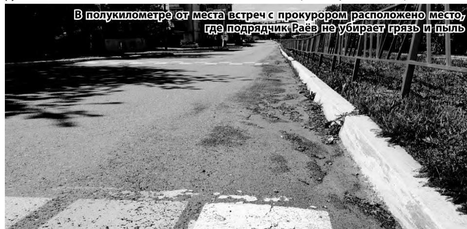
В полукилометре от места встреч с прокурором расположено место, где подрядчик Раёв не убирает грязь и пыль

Теперь перейдем к очевидным вещам. Земля в центре города. Суд доказал, что передача земли была осуществлена незаконно. Но Прокуратура, как я считаю, сделала все возможное, чтобы решение суда осталось просто бумагой. Теперь кто-то по-