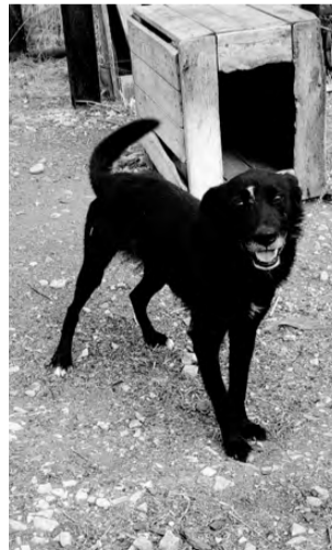
БЛЭК. Высокий, послушный, приучен к цепи и вольеру