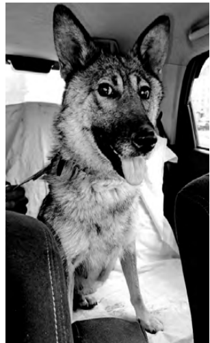
НАЙДА. Крупная, умная, послушная, хорошо ладит с людьми

В городе Реж в пункте кратковременного содержания безнадзорных животных находятся собаки и кошки, готовые обрести дом и любящих хозяев. Животные прошли ветеринарный карантин, поставлены необходимые прививки. Есть щенки и котята, возраст от 1 месяца до года. Если Вы хотите обрести друга и надёжного охранника, звоните по телефону 8-912-674-23-28. Мы можем доставить вам понравившееся животное. Уважаемые режевляне, если у вас есть возможность помочь кормом для животных, то мы с радостью примем крупы (кроме перловой - ее собакам нельзя), макаронные изделия, кости, лапки кур, хлеб, сухари, сухой корм. Заранее огромное всем спасибо.