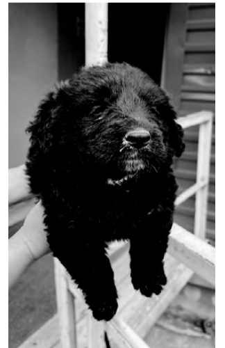
ЩЕНКИ. От крупной собаки, возраст 2 месяца