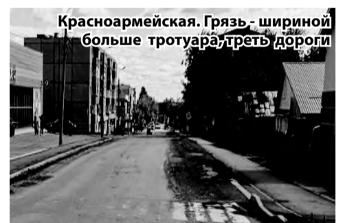
Красноармейская. Грязь - шириной больше тротуара, треть дороги

При этом позиция Управления как органа, который должен выполнять функции, связанные с предоставлением земельных участков в соответствии с действующим земельным законодательством, не допуская строительства объектов на не предоставленных для этого земельных участках, представляется противоречащей указанным функциям и целям деятельности.