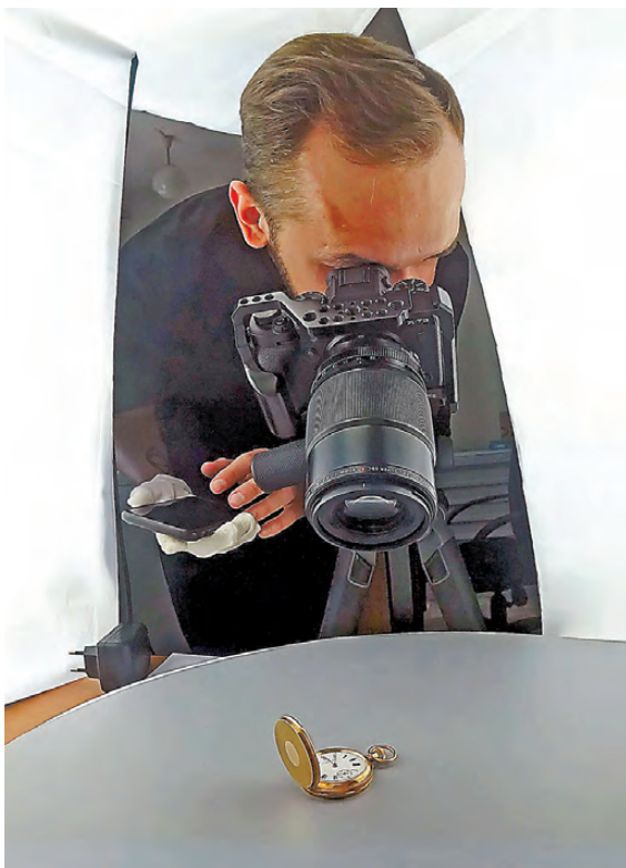
Раритетным экспонатам устроили фотосессию.