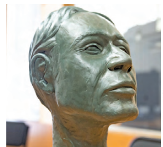
На реконструкцию ушло пять килограммов пластилина.

Метод пластической реконструкции студентка осваивала в Тюмени. Работа с черепом, найденным на площади 1905 года, стала ее выпускным проектом, выполненным на отлично. Говорят, в Екатеринбурге подобных специалистов сейчас нет, вернее, не было. Что касается черепа неизвестного в мундире, его вернут в хранилище Института экологии растений и животных УрО РАН, чтобы воссоединить со скелетом. После того как кости опишут, останки перезахоронят.