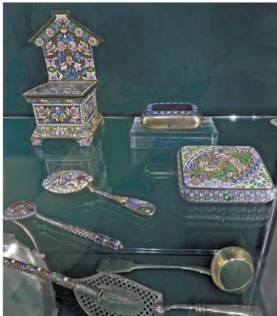
Среди сокровищ кладовой — утилитарные предметы конца XIX века, украшенные перегородчатой эмалью.

А пока в музее открылась выставка «Хранитель времени», приуроченная к 30-летию ювелирного дома MOISEIKIN. В изящных цветочных миниатюрах, серебряных и бронзовых скульптурах, созданных командой камнерезов, ювелиров, модельеров и закрепщиков, прослеживаются бережно сохраняемые традиции уральского камнерезного искусства.