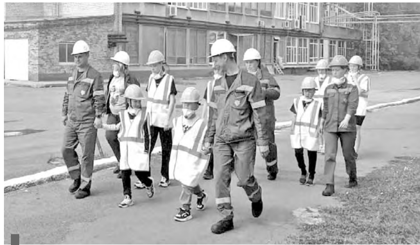
На экскурсии по заводу, где работают папы и мамы

Экскурсия началась с участка подготовки производства, где гостям рассказали, как создается модельно-литейная оснастка. За-