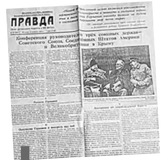
Тот самый экземпляр газеты «Правда»