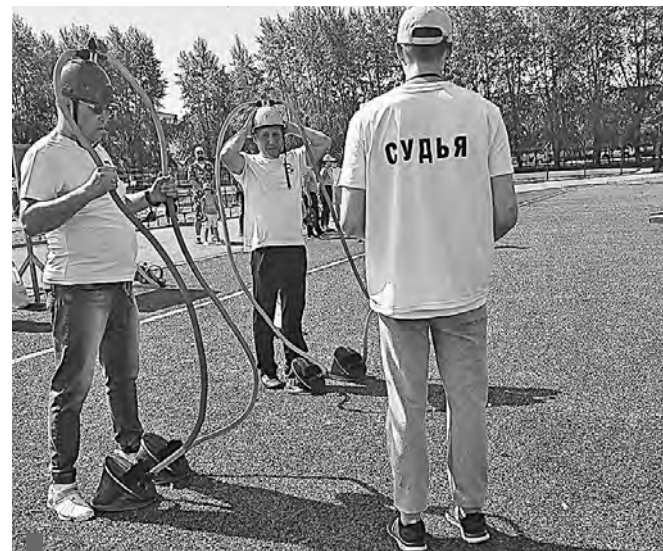
В командной игре «Хдыщ» следовало надуть и лопнуть воздушные шары

Сезон завершен. В августе будут организованы учебно-тренировочные сборы для подготовки к новым победам.