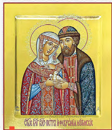
Икона выполнена иконописцами из Сергиева Посада

Считаются покровителями православной семьи и брака. День их памяти совпадает с общенациональным праздником – Днем семьи, любви и верности (учрежден в 2008 году).