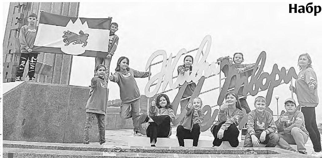
Эта смена в «Океане» запомнится знаменским ребятам на всю жизнь