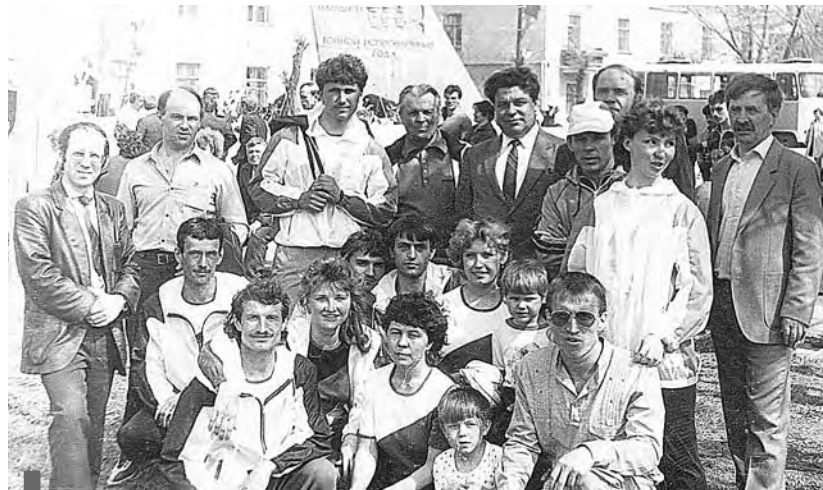
Команда огнеупорного завода на легкоатлетической эстафете в честь Дня Победы на призы газеты «Знамя Победы», 1986 г.

Приносите старые фотографии в редакцию газеты «Знамя Победы» (ул. Пушкинская, 4) или присылайте на эл. почту olgademina27@mail.ru . При этом необходимо указать, кто или что изображено на снимке, в каком году он сделан, а также свой телефон.