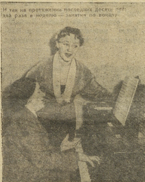
И так на протяжении последних десяти лет: два раза в неделю — занятия по вокалу.

* Цифры после названия фильма обозначают порядковый номер киноустановки в разделе «РЕПЕРТУАР» (см. 4-ю стр.).