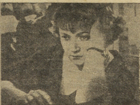
На снимках: кадры из фильмов «Укротительница тигров» (слева), «Медовый месяц» (справа).

В. НАВРОЦКАЯ, Е. СМОЛЯНСКАЯ. («Советский экран»).