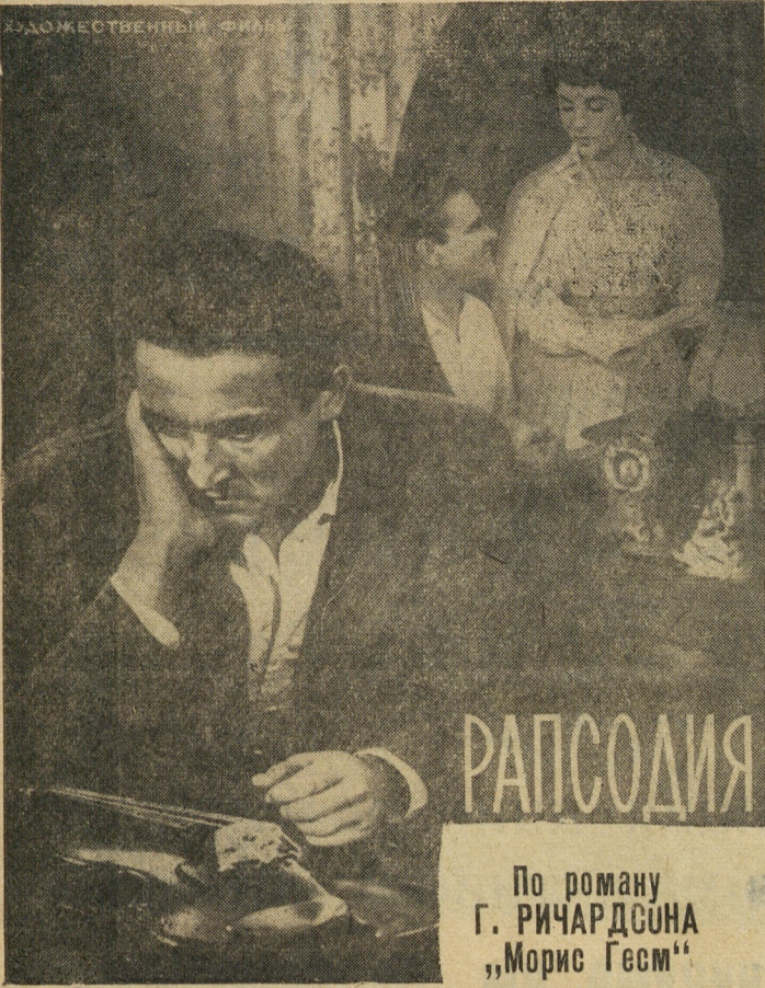
По роману Г. РИЧАРДСОНА „Морис Гесм“

В ПЕРВЫЕ ДНИ своего увлечения Полем Луиз не думала ни о чем. Все было хорошо. Они совершали легкие прогулки, катались на автомобиле, и ничто не мешало их счастью. Кажется, Поля забыл даже о музыке. Все свободное время он посвящал только ей, ей одной — Луиз. Независимо, что профессор Поля был недоволен своим учеником. Зато довольна была Луиз — довольна и счастлива.