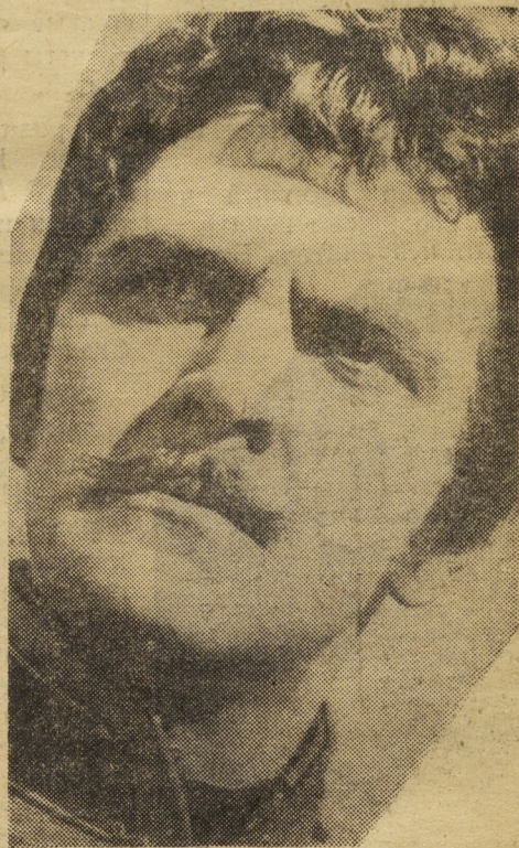
Поручик Ржевский в фильме «Гусарская баллада»

этого было бы достаточно, чтобы причислить его к лучшим интерпретаторам русской классики в советском кино.