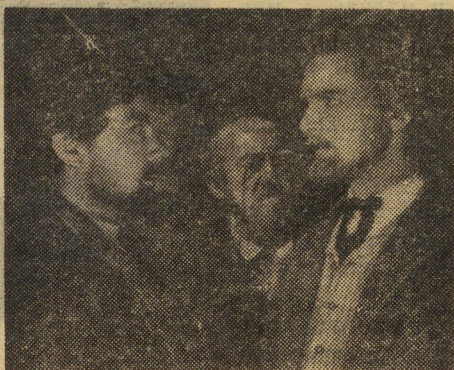
Князь Мышкин в фильме «Идиот»

Если бы молодой актер Юрий Яковлев сыграл только одну эту роль в пырьевской экранизации «Настасьи Филипповны», то и