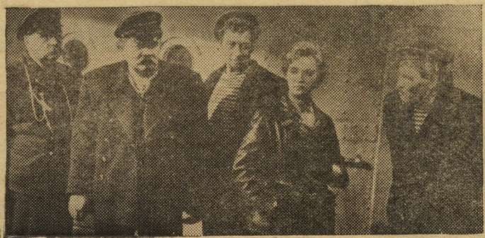
На снимке: кадр из фильма «Оптимистическая трагедия».