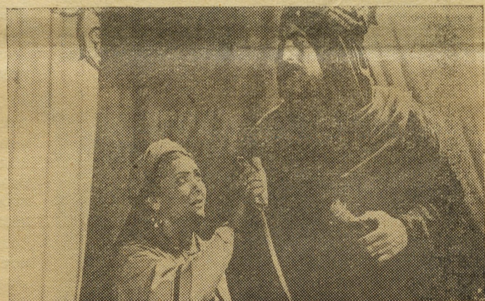
Производство киностудии „АЗЕРБАЙДЖАНФИЛЬМ“