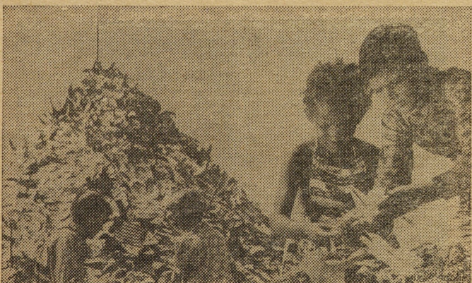
Кадр из фильма «Здравствуйте, дети!».