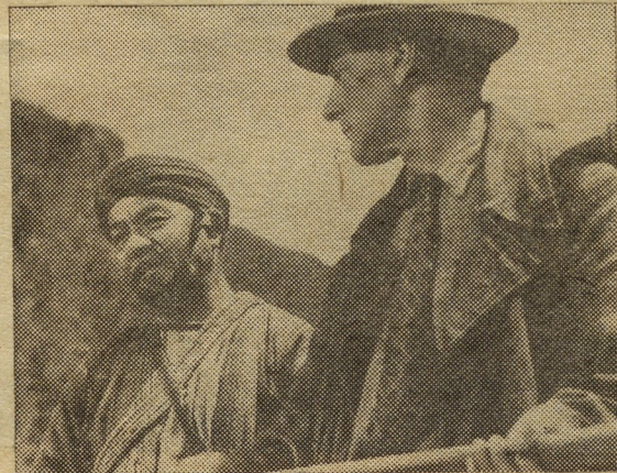
Кадр из к/ф «Операция «Кобра»