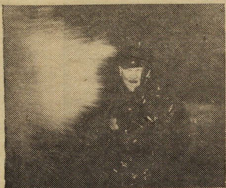
Производство киностудии „Мосфильм“

РЕПЕРТУАР кинотеатров, дворцов и домов культуры и клубов г. Свердловска