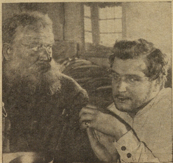
Кадр из к/ф «Казачи»