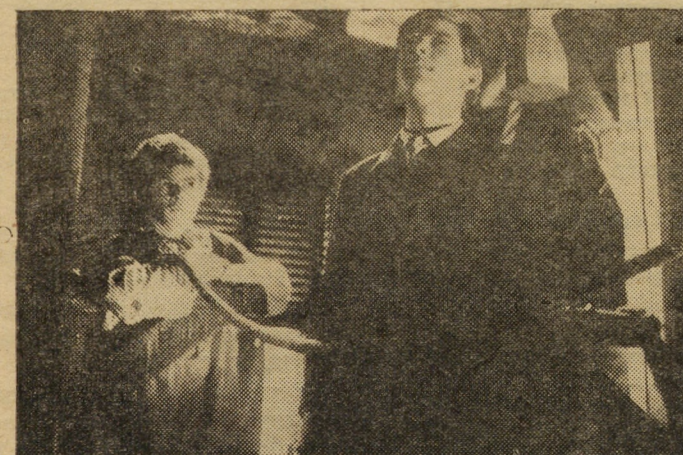
Производство Братиславской студии художественных фильмов, Чехословакия.