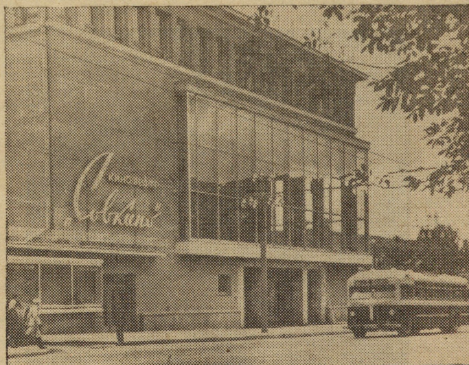
На снимке: реконструированное здание к/т «Совкино».