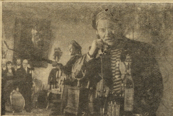
Кадр из к/ф «Незабываемый 1919 год»

Более тридцати лет на экране... Сколько ролей — и главных, и эпизодических — создано за это время! Доктор Рождественский в ленте «Во имя жизни», полковник Сербиченко в фильме «Звезда» (по повести Э. Казакевича), опытный подпольщик-революционер Сигизмунд Раевский в картине «Рожденные бурей», умный прощательный Уинном Скотт из ленты «Белый клык», двурушник Пятаков в фильме «Вихри враждебные», затем фильмы «Дорога правды», «Костер бессмертия», «Моя дочь», «Киевлянка», «Заговор обреченных», «Следы на снегу», «Координаты неизвестны», «Заре навстречу», и наконец, последняя роль О. Жакова в новом фильме «Путь к причалу».