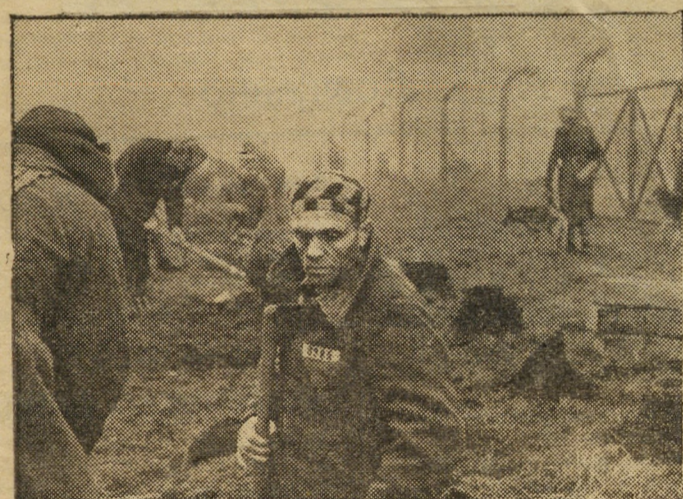
Производство киностудий им. М. Горького и ДЕФА (ГДР).