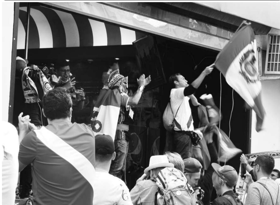
Мундиаль в Екатеринбурге.