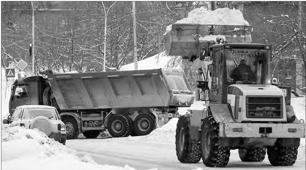
Днем 24 декабря отгружали снег с обочин улицы Карла Маркса. Работает МУП «Тагилдорстрой».

Как уже сообщал «ТР», в январе за уборку снега дорожники взялись активно и работали днем и ночью.