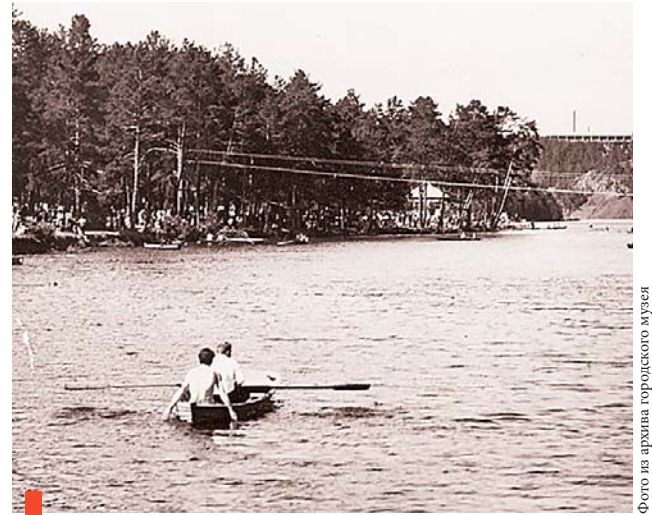
Катание на лодках в городском парке, конец 1960-х

В честь открытия парка был подготовлен концерт художественной самодеятельности. Присутствующие смогли принять участие в аттракционах и спортивных состязаниях. Для любителей танцев работала танцплощадка.