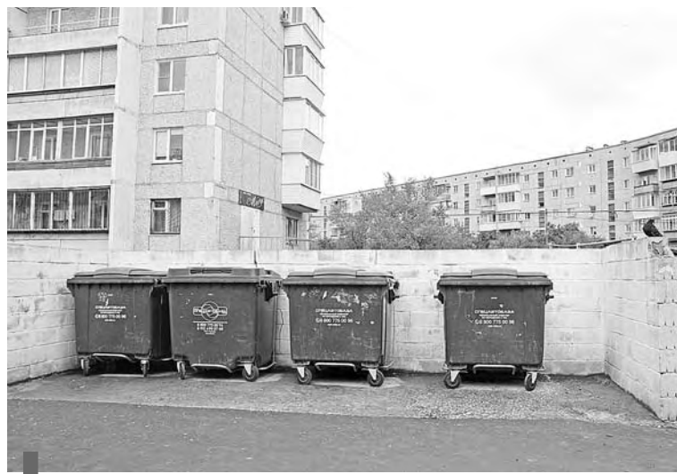
За чистой контейнерной площадкой во дворе домов по Пушкинской следят сотрудники УК и сами жильцы