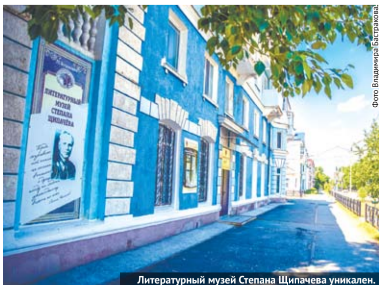
Литературный музей Степана Шипачева уникален.

Уральский государственный академический русский народный хор, волейбольная команда «Уралочка», Уральский добровольческий танковый корпус, дом Севастьянова, Невьянская наклонная башня, сказы Бажова, наследие Владислава Крапивина, «Коляда-театр», перевал Дятлова, Шигирский идол, Белоярская атомная станция, Фарфор Сысерти, Литературный музей Степана Шипачева в Богдановиче. Екатеринбург, в этом году отмечающий свое 300-летие, выдвинул Исторический сквер, усадьбу Харитоновых-Расторгуевых, городок Чекистов, озеро Шарташ, Белую башню. С полным списком можно ознакомиться на сайте Общественной палаты.