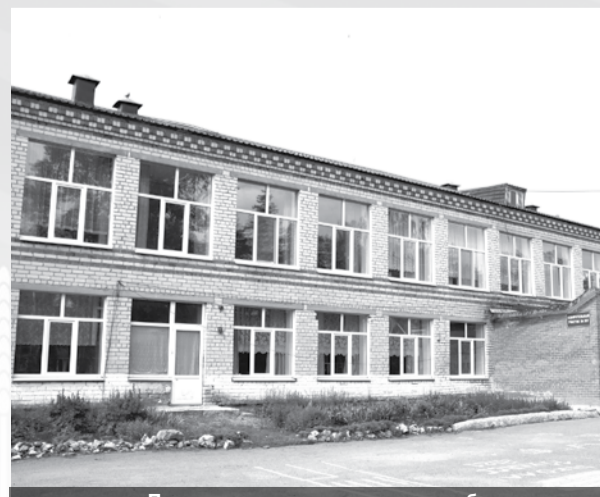
Пришкольная территория всегда благоустроена: трава скошена, а клумбы благоухают высаженными цветами.

В этом году село участвует в конкурсе «Здоровое село - территория трезвости», в рамках которого проводится комплекс мероприятий, направленных на пропаганду трезвого и здорового образа жизни. Более того, сейчас ведутся работы по обустройству места отдыха в рамках комплексного благоустройства общественной территории у школы. Благоустройство разделено на два этапа. На первом выполняется устройство дорожно-тропиночной сети, озеленение и освещение, обустройство детской площадки, места для проведения мероприятий, спортивной зоны с баскетбольно-волейбольной и тренажёрной площадками, установка сценического комплекса. На втором этапе предстоит установка тренажёров, частично ограждений, обустройство прыжковой ямы и парковочных мест. Данное пространство прошло отбор на предоставление субсидий из областного бюджета местным бюджетам муниципальных образований в рамках государственной программы Свердловской области «Формирование современной городской среды на территории Свердловской области на 2018-2024 годы».