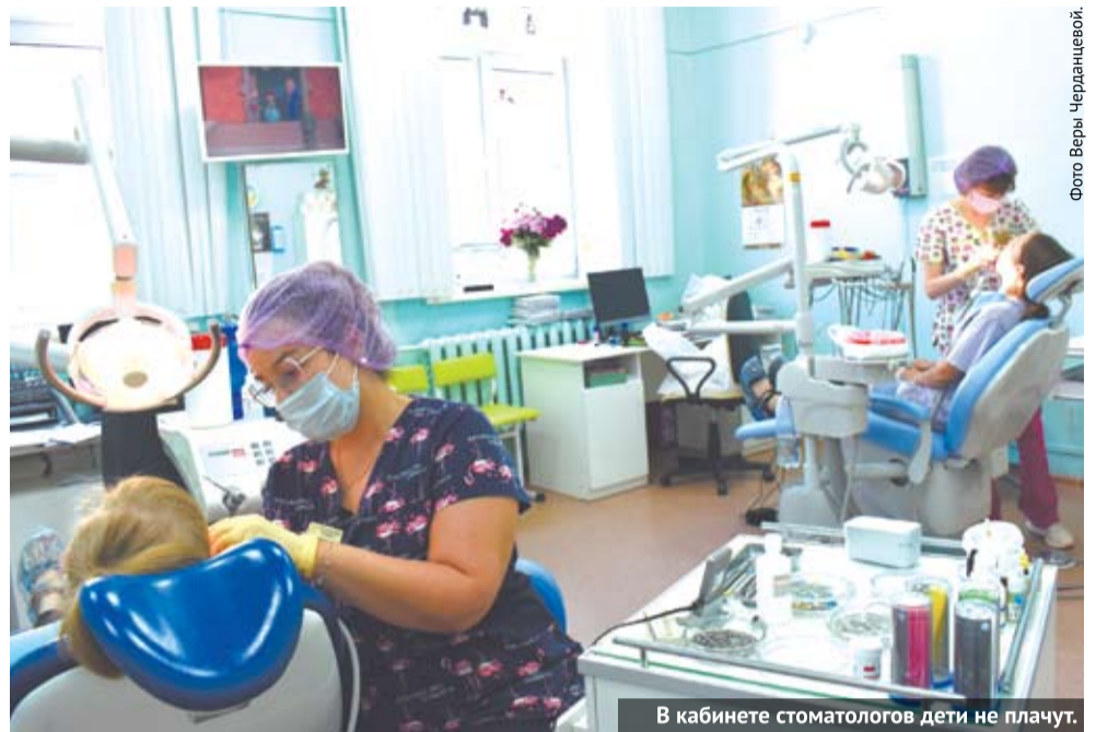
В кабинете стоматологов дети не плачут.