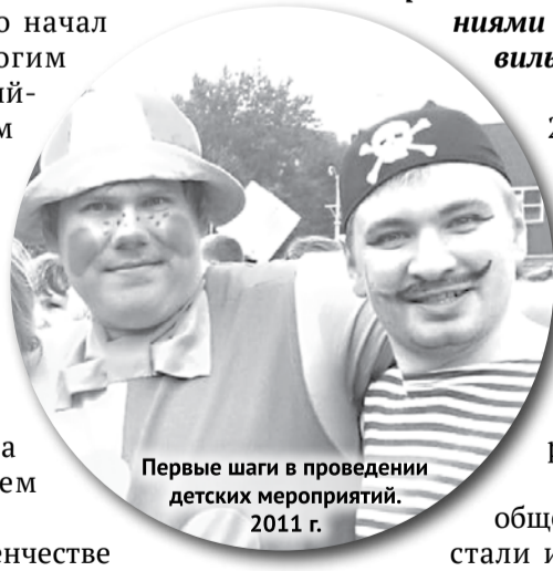
Первые шаги в проведении детских мероприятий. 2011 г.