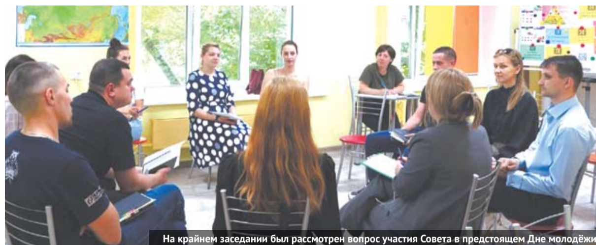
На крайнем заседании был рассмотрен вопрос участия Совета в предстоящем Дне молодёжи.

В конце 2022 года на основании постановления главы был создан Совет молодёжи при главе ГО Богданович, главной целью создания которого является совершенствование работы с молодёжью, более эффективной реализации молодежной политики на территории округа