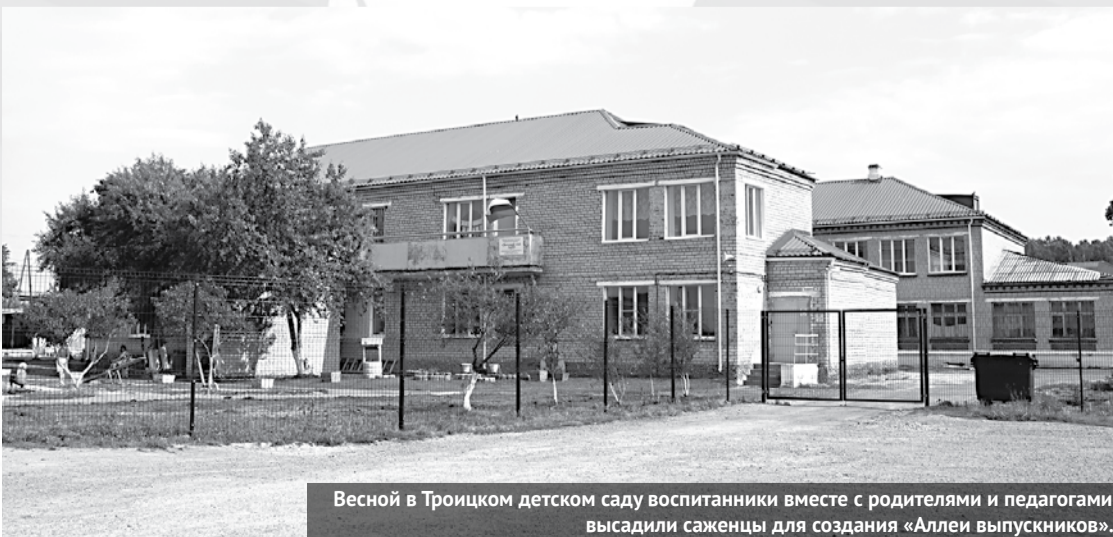
Весной в Троицком детском саду воспитанники вместе с родителями и педагогами высадили саженцы для создания «Аллеи выпускников».

На территории села расположены ФАП, почта России, магазины, два раза в неделю приезжает мобильный офис «Сбербанка». Также в