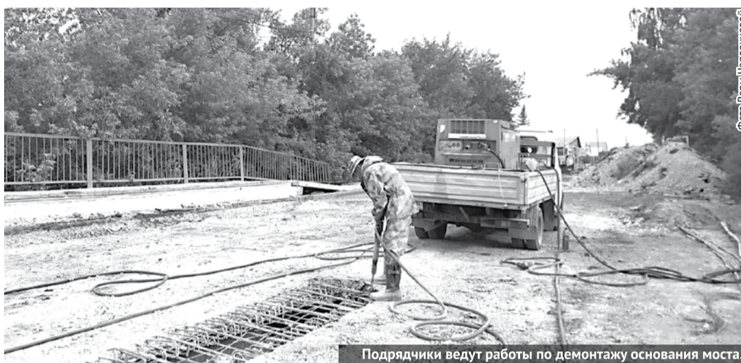
Подрядчики ведут работы по демонтажу основания моста.

Как мы уже сообщали, с 9 июня в Богдановиче ведется ремонт моста через реку Кунару по улице Степана Разина. В настоящее время здесь идет демонтаж основания конструкции