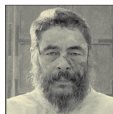
СТС • 00.45 «Французский вестник» (18+)