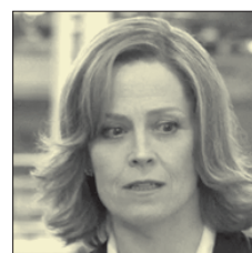
СТС • 23.20 «Робот по имени Чаппи» (16+)