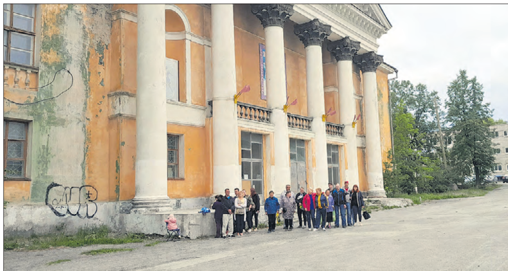
Фото из группы «Возродим сквер за ДК «Горняк» в ВК

Посельчане борются за восстановление местного Дворца культуры «Горняк». Здание давно заброшено, а сейчас и вовсе официально не охраняется, так что вандалы и мародеры в ДК — частые гости. Жители Магнитки заколачивают окна, пытаются хоть как-то законсервировать и охранять заброшенный Дворец. Но своими силами справиться не выходит — окна снова разбивают, здание продолжает разрушаться. Отчаявшись, люди записали обращение к губернатору Свердловской области Евгению Куйвашеву.