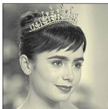
СТС • 20.00 «Белоснежка. Месть гномов» (12+)