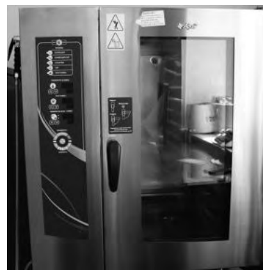
Гордость столовой - пароконвектомат

Столовая Зайковской школы № 2 в 2017 году признана лучшей в Ирбитском районе. Нынче столовая участвовала в областном конкурсе. Команда Зайковской школы № 2 по итогам заочного тура прошла в финал регионального конкурса «Лучшая школьная столовая». Он состоялся под занавес учебного года на базе Екатеринбургского торгово-экономического техникума.