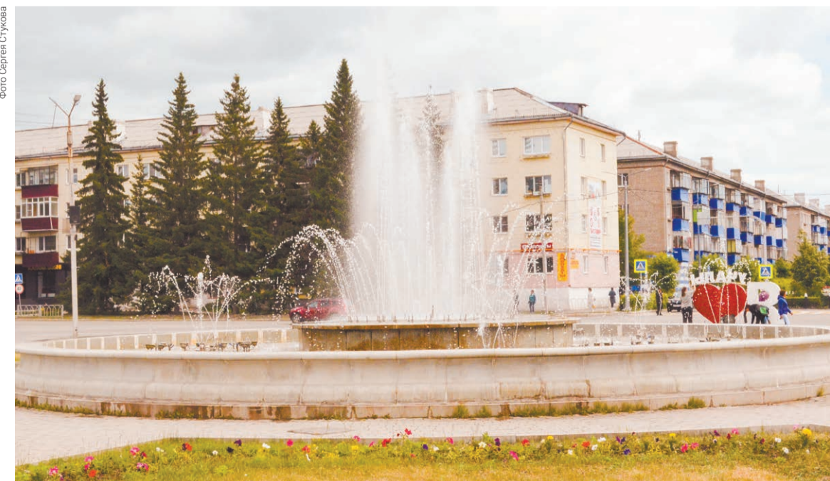
Учалы. Фонтан в центре города

Пять ее источников служат началом реки и находятся в деревнях Бурангулово, Татлембетово и Апсаламово. Это удивительное место, где вы можете ощутить силу и красоту природы.