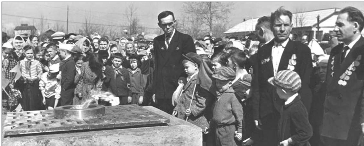
Зажжение Вечного огня. Май 1975 года.

Оставили ещё небольшой запас места на будущее – архивы обнаруживают, оцифровывают, так что, новые имена появятся. В работе – 10 фамилий, ждём документального подтверждения.