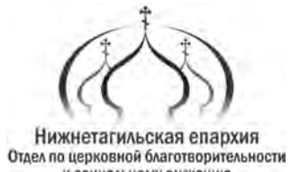
Нижнетагильская епархия Отдел по церковной благотворительности и социальной службе

e-mail: slujenie-nt@ya.ru сайт: tagisergiya.ru