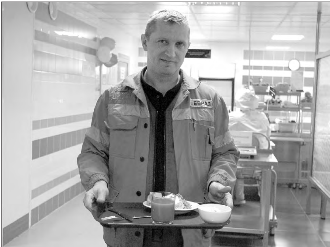
В новой столовой.