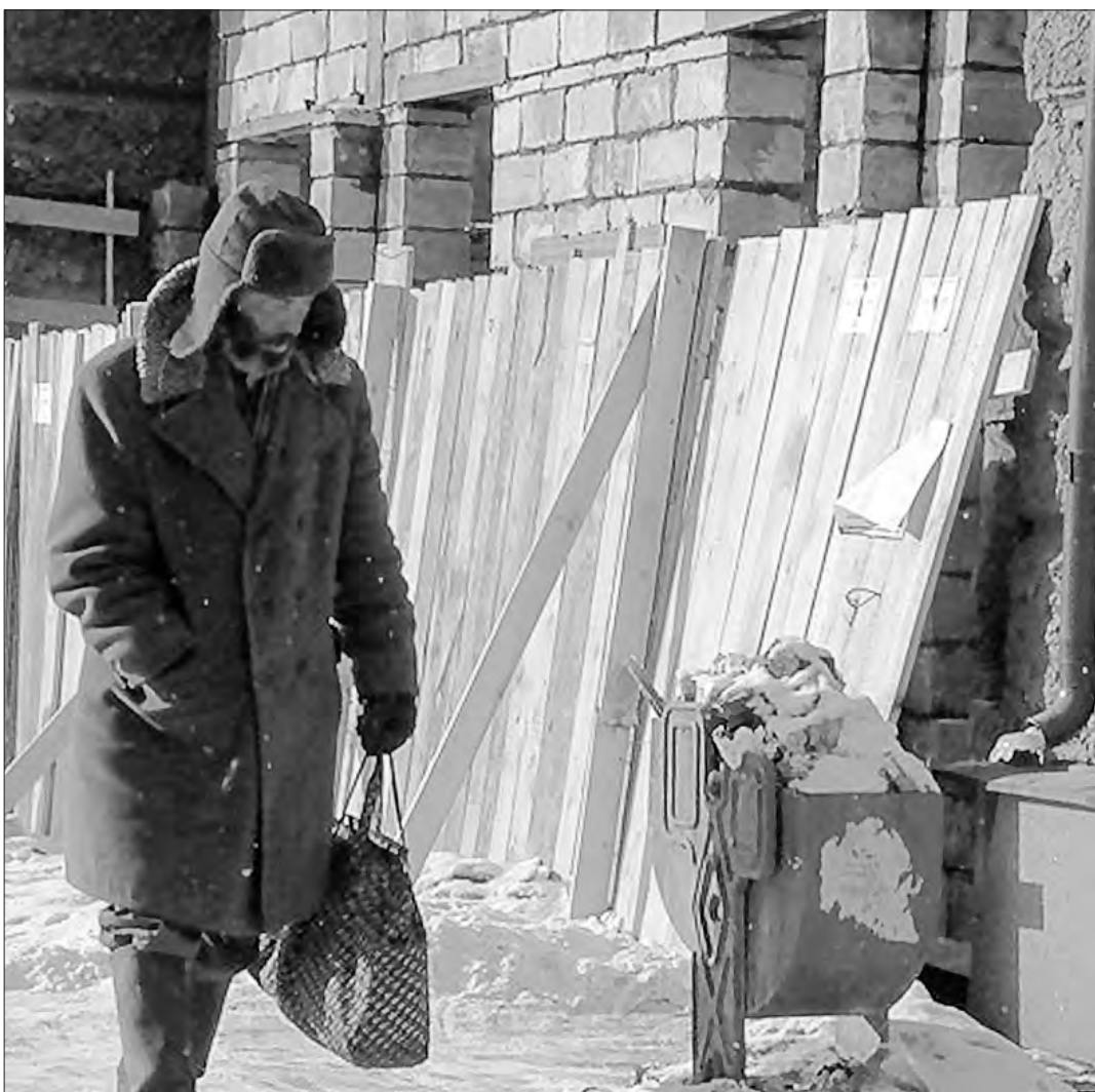
Без дома, без пищи, без семьи...

В народе ходит легенда о том, что алкоголь согрывает. Это неправда - алкоголь приглушает ощущения.