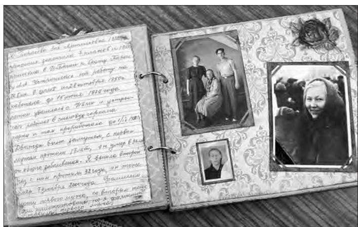
Страница из семейного альбома Зои Артемьевны Бердинской.

Кроме того, в магазинах книги по скрапбукингу стоят в среднем от 200 до 700 рублей, а в библиотеке по-прежнему с красочными пособиями, где даны пошаговые инструкции изготовления страниц для альбома, можно бесплатно. По предварительной заявке здесь проведут специальный мастер-класс и для школь-