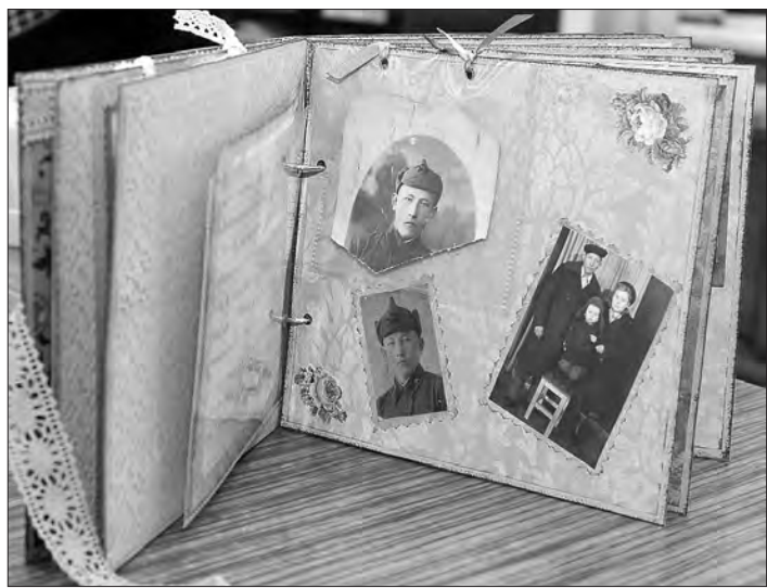
Так может выглядеть и ваш альбом с семейными реликвиями.

ного кружка рукоделия, и для отдельной семьи, пожелавшей сделать для себя альбом с домашними реликвиями. Так что не стесняйтесь и обращайтесь за помощью