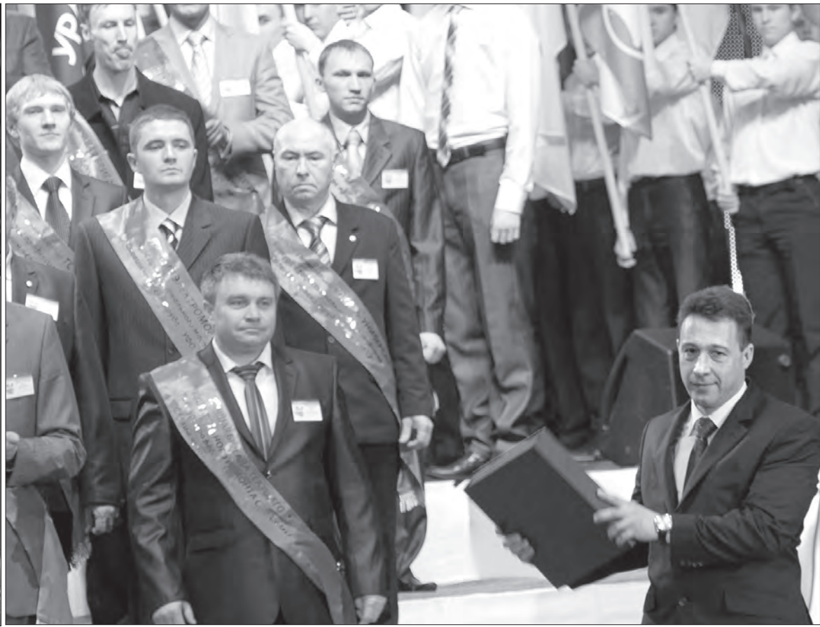
Игорь Холманских с обращением победителей конкурса к президенту РФ Владимиру Путину.

Вчера в «Металлург-форуме» состоялось торжественное награждение победителей окружного конкурса «Славим человека труда!»