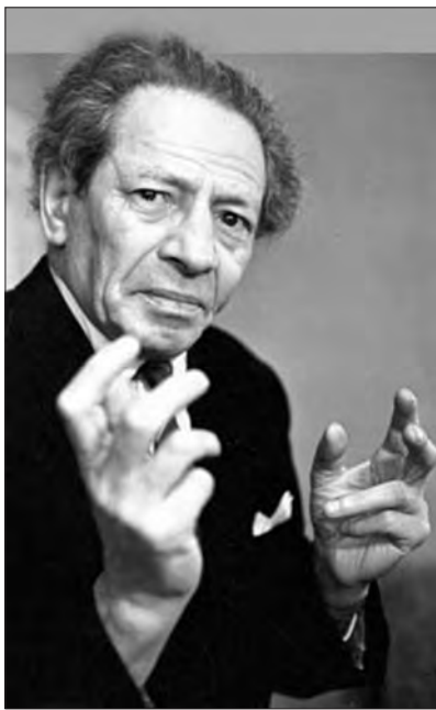
Реальный Вольф Мессинг и Евгений Князев в роли Вольфа Мессинга (фильм «Вольф Мессинг: Видевший сквозь время»).