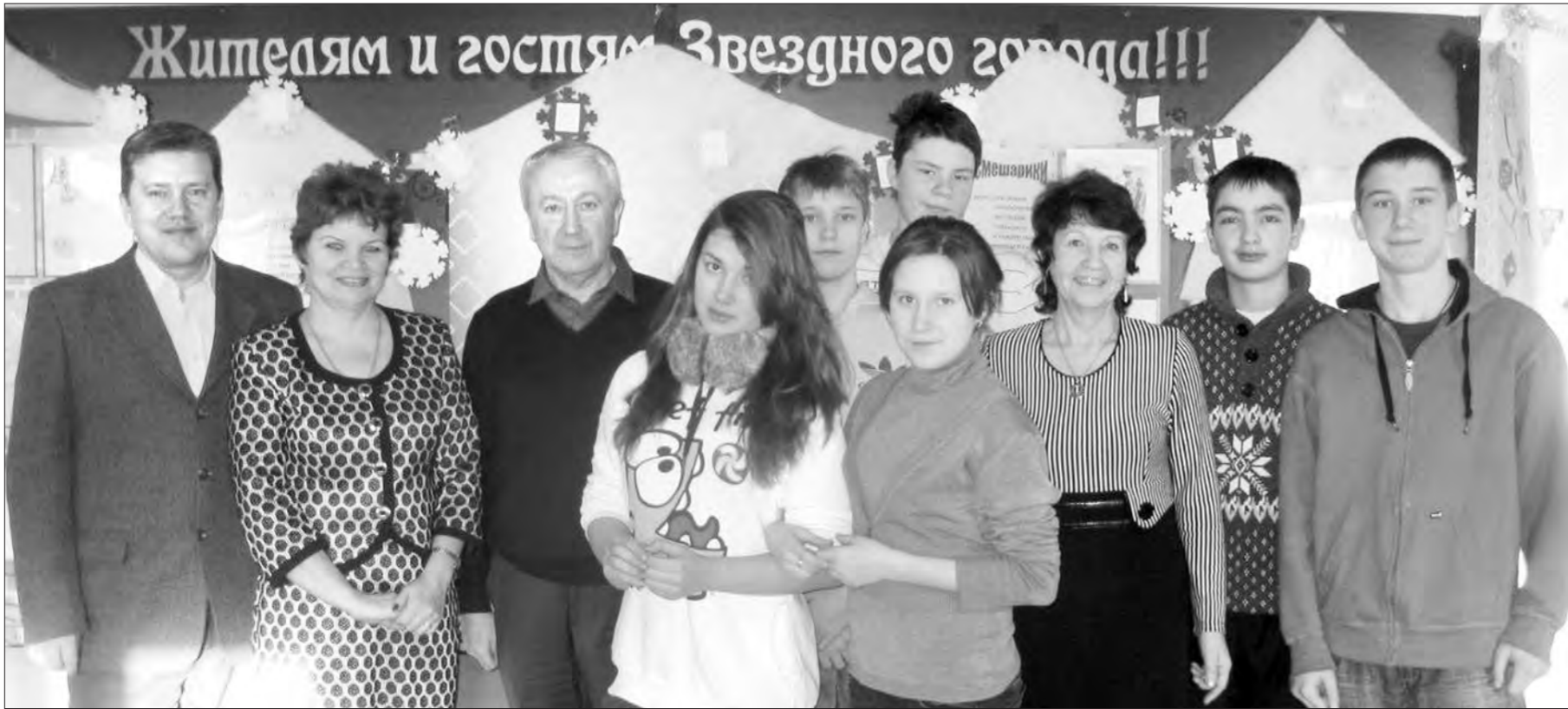
Фото на память с высокими гостями оздоровительного комплекса.

Зимняя смена, с 27 декабря по 9 января, состоялась в муниципальном бюджетном учреждении «Детский оздоровительный комплекс «Звездный».