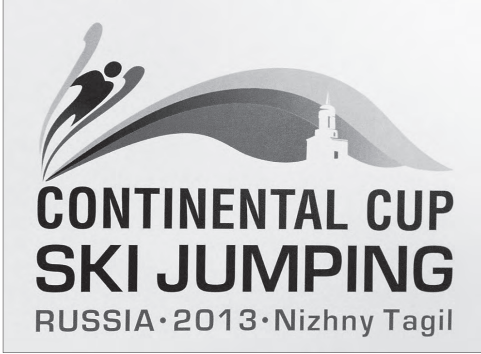
Эмблема этапа Континентального кубка.