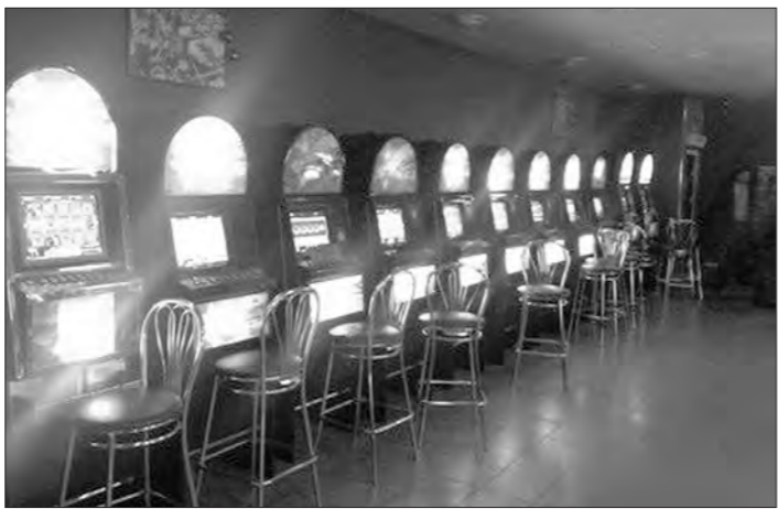
Игровые автоматы приглашали посетителей в мир приключений.

Также результативно сработали сотрудники отдела полиции №19. В очередной раз проверке подвергся игровой зал по улице Металлургов, 5, ранее уже неоднократно попадавший в поле зрения полицейских. Начальник уголовного розыска отдела полиции, проезжая в вечернее время мимо заведения, застал момент, когда