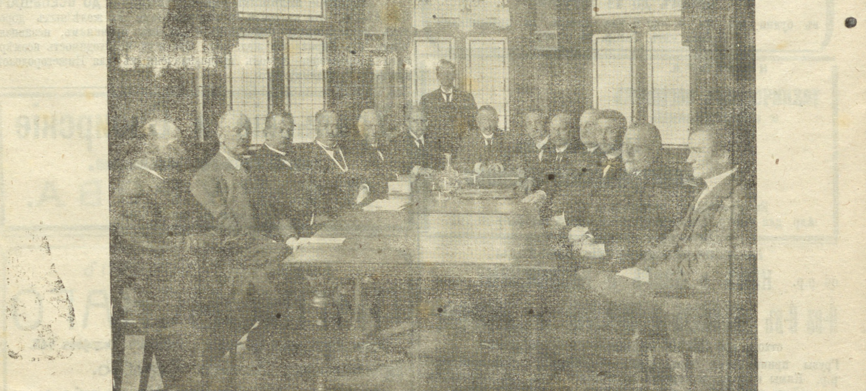
Подготовительное собраніе въ Народномъ Домѣ въ Стокгольмѣ. Въ Стокгольмѣ состоялось подготовительное собраніе по вопросу о созываемой по почину голландскихъ социалістическихъ конференціи.