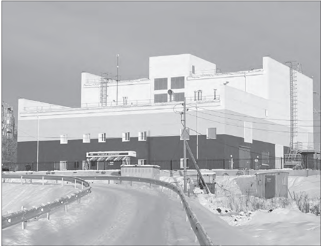
Новое здание подстанции.