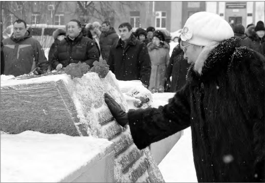
Во время митинга.

У памятника воинам, погибшим в локальных войнах планеты, состоялся митинг, посвященный очередной годовщине ввода советских войск в Афганистан (1979 год).