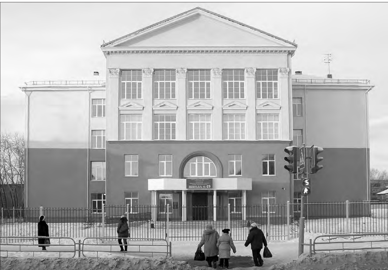
Школа №49 готова к приему учеников.