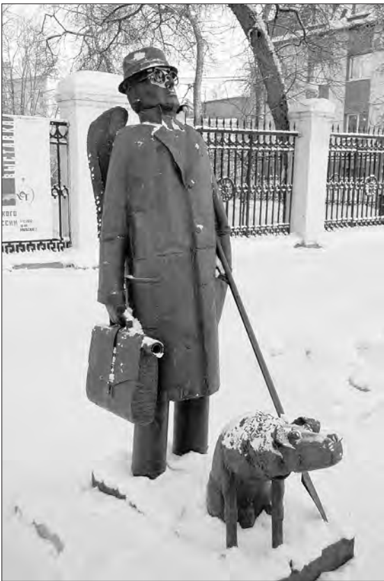
Городской Ангел всегда готов помочь тагильчанам.