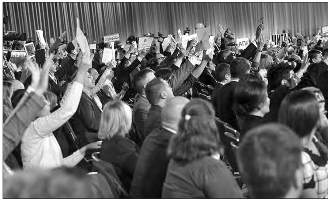
Идет пресс-конференция.

Реплика: ...Я вообще не хотела о плохом, но придется. Вот границы наши, вы знаете, не очень они зашифрованы. Для кого мы строим? И вот этот бывший министр обороны – это такая боль. И, мне кажется, вы его назначили