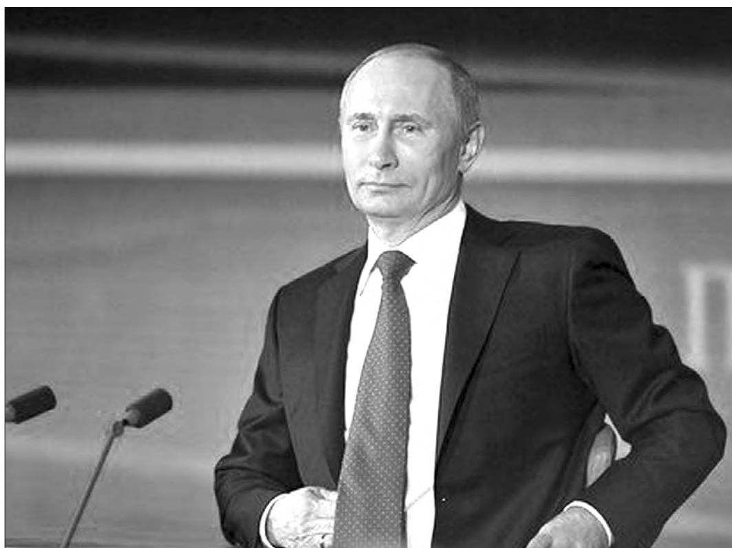
Владимир Путин.

В четверг в Москве состоялась большая пресс-конференция президента России Владимира Путина, которая длилась 4 часа 33 минуты.