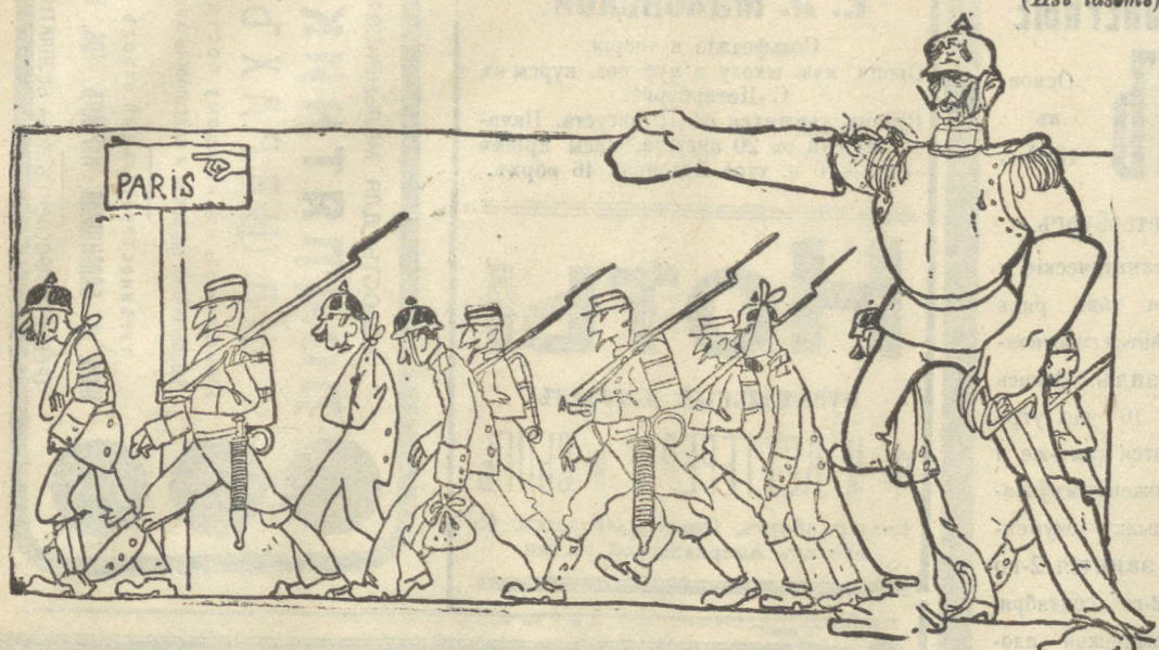
Вильгельм: Я говорю, что победа наша скоро будет в Париже.

В Париж прибыл первый транспорт немецких германцев.