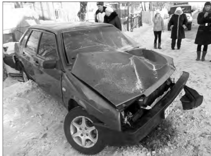
Серьезно пострадали и водитель, и пассажир, и автомобиль.

Не справился с управлением и врезался в дерево 21-летний водитель «Жигулей» 99-й модели.