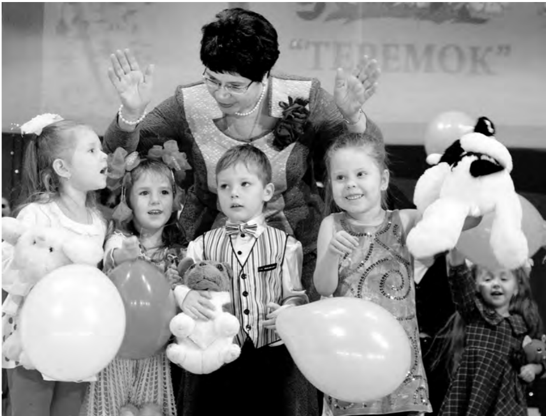
На сцене - студия «Теремок».