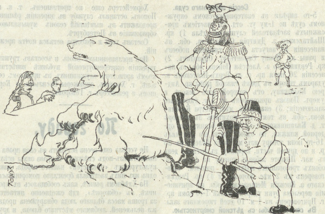
КЪ СОВРЕМЕННОМУ ПОЛИТИЧЕСКОМУ МОМЕНТУ.