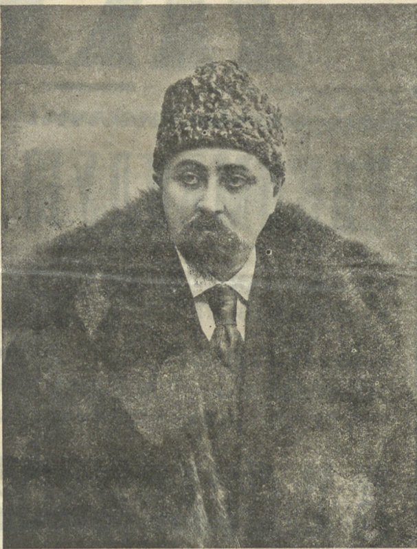
Въ концѣ 90-хъ гг.