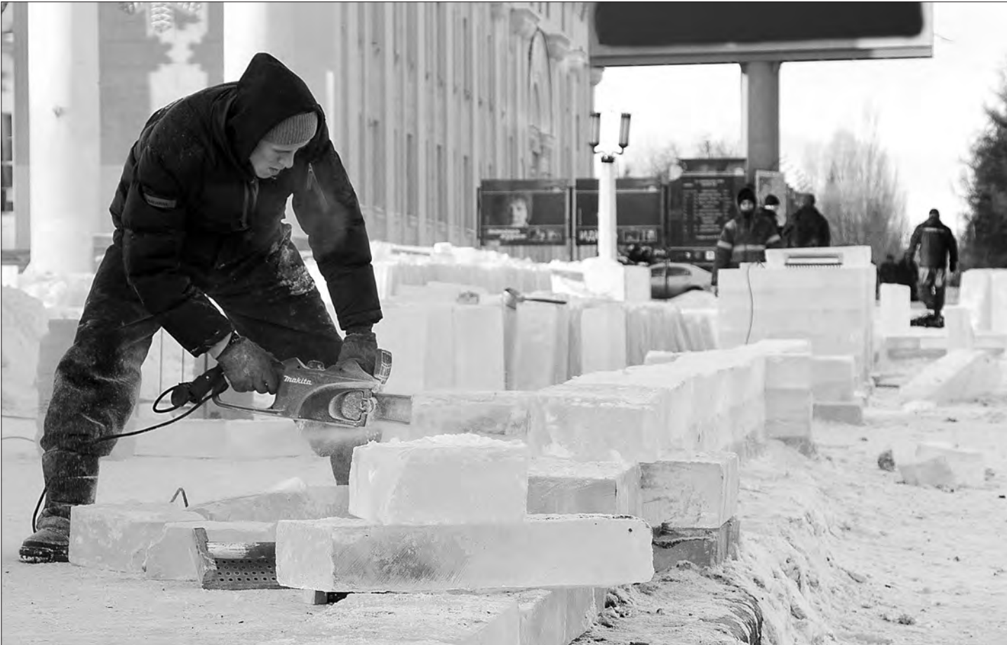
Ледяные блоки для будущего ограждения Ледового городка.