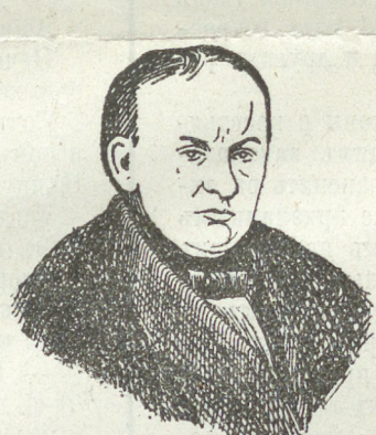
В. А. Жуковский.