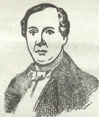
Гр. Н. С. Лаиской.