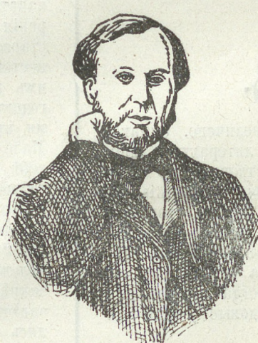
Н. А. Милютинъ.