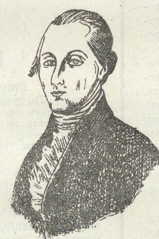
А. И. Радищевъ.