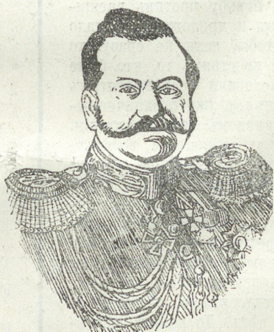
Н. И. Ростовцевъ.