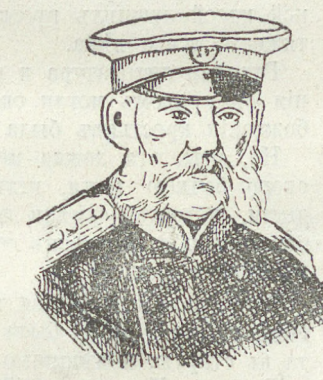
Д. А. Милютинъ.