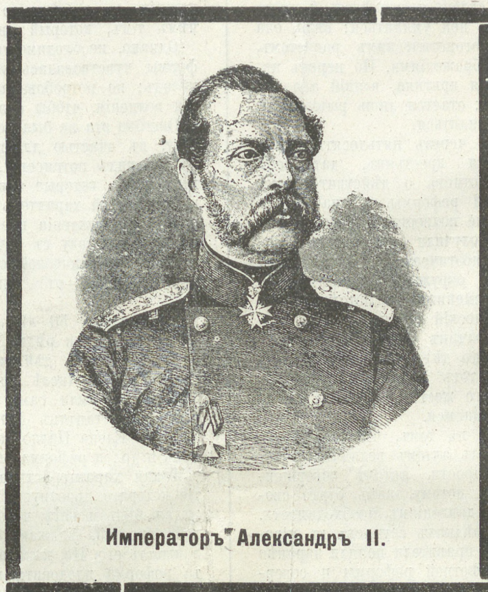
Императоръ Александръ II.