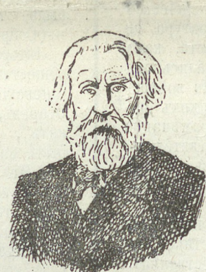
И. С. Тургеневъ.