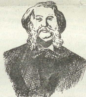
Д. В. Григоровичъ.