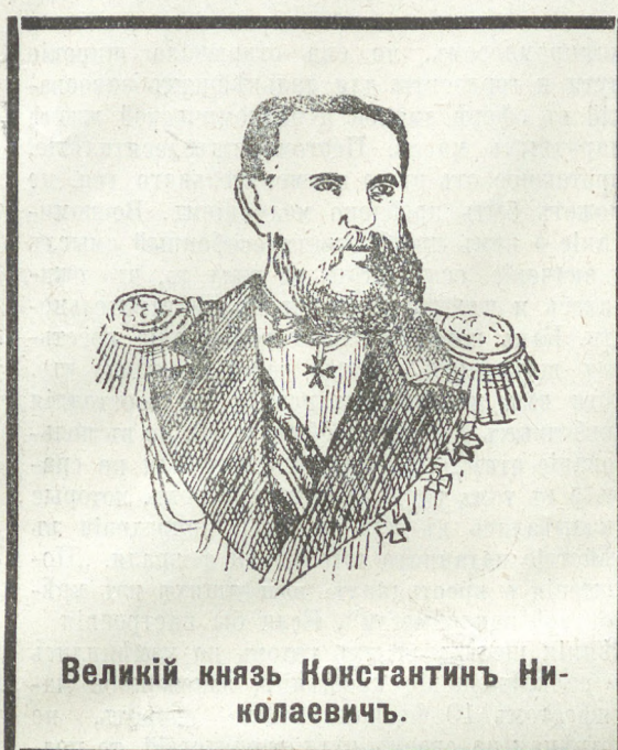
Великий князь Константин Николаевичъ.