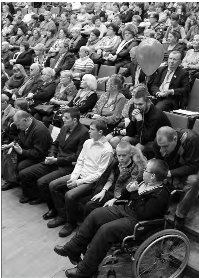
В зрительном зале.