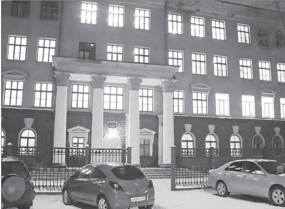
Внешне здание школы №85 выглядит вполне респектабельно.

В школе, которую запустили в учебный процесс, падает штукатурка, - подвел итог глава города. - 20 тысяч рублей, выделенные на ремонт, и остальные деньги, добытые ОУ, не обеспечили нормальные условия. За новогодние каникулы обследуем, определим технологию и объем ремонта, который необходимо будет сделать летом. Решение об этом примем в январе. Деньги в бюджет будут заложены. Другого выхода нет, потому что школа становится опасной и для учителей, и для родителей. А самое главное - для детей, которые бегают и топают. Штукатурка может обрушиться в любой момент. Прикрытие натяжными потолками в отдельных классах, с инженерной точки зрения, не верно.