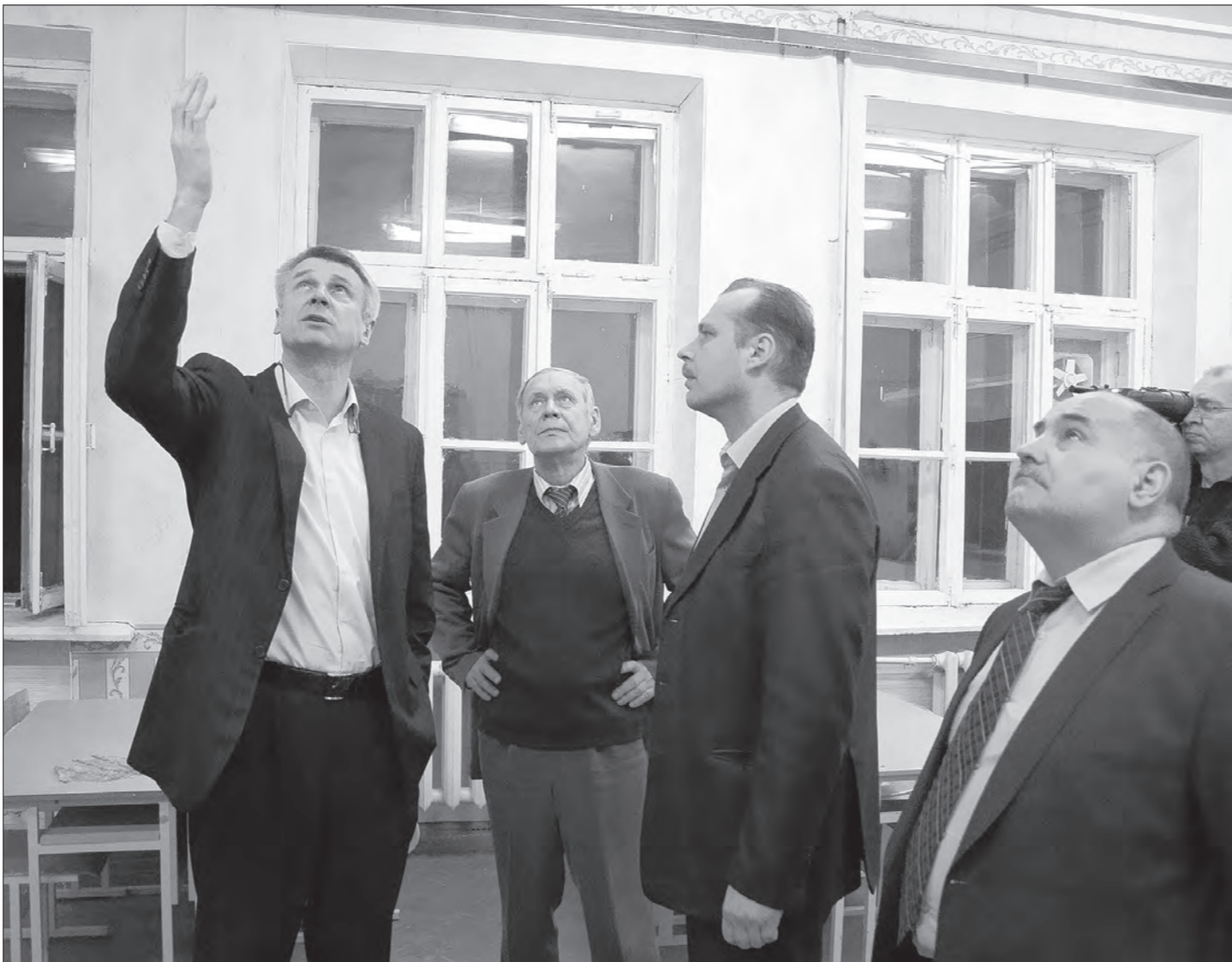
Глава города лично осматривает проблемные места.