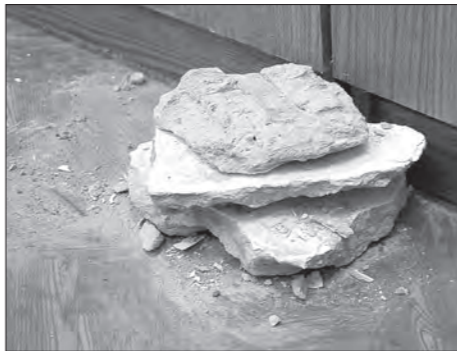
Вот что упало с потолка.

Прикрыли разрушающиеся конструкции. А что под ними? Неведение опасности.