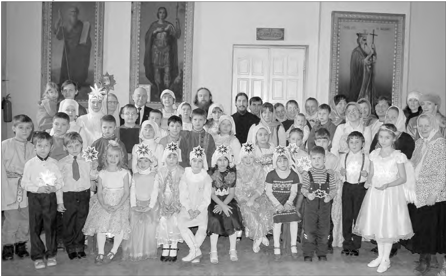
На празднике Рождества в воскресной школе.

Группа тагильских педагогов заняла второе место на втором этапе всероссийского конкурса «За нравственный подвиг учителя» в области педагогики, воспитания и работы с детьми и молодежью до 20 лет.