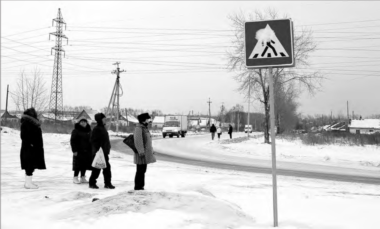
Появился знак, но уступают дорогу пешеходам далеко не все водители.