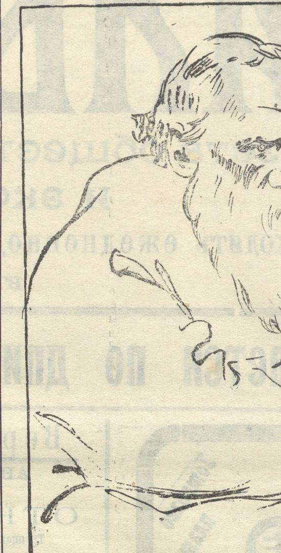
Колоссъ и пигмей.