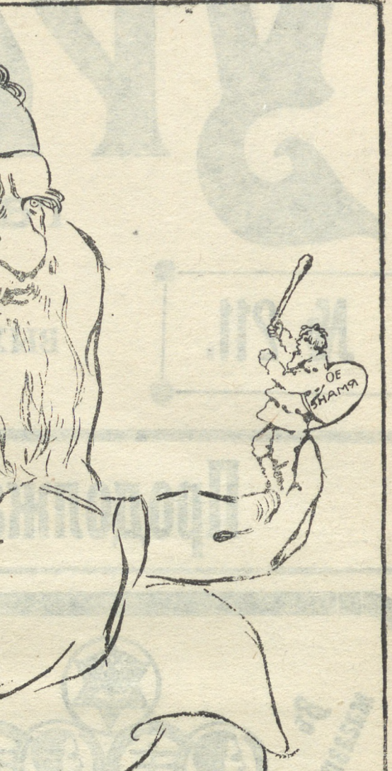
Колоссъ и пигмей.