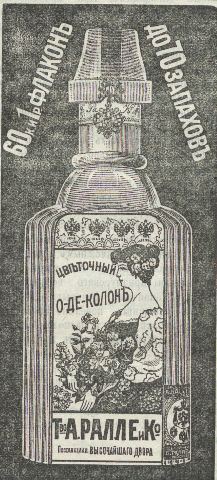
60-и флаконъ до 100 каплевокъ