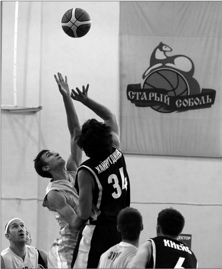
Первая секунда матча.

23 октября. «Старый соболь» (Нижний Тагил) – «Рускон-Мордовия» (Саранск) – 70:93 (25:16, 6:32, 18:28, 21:17).