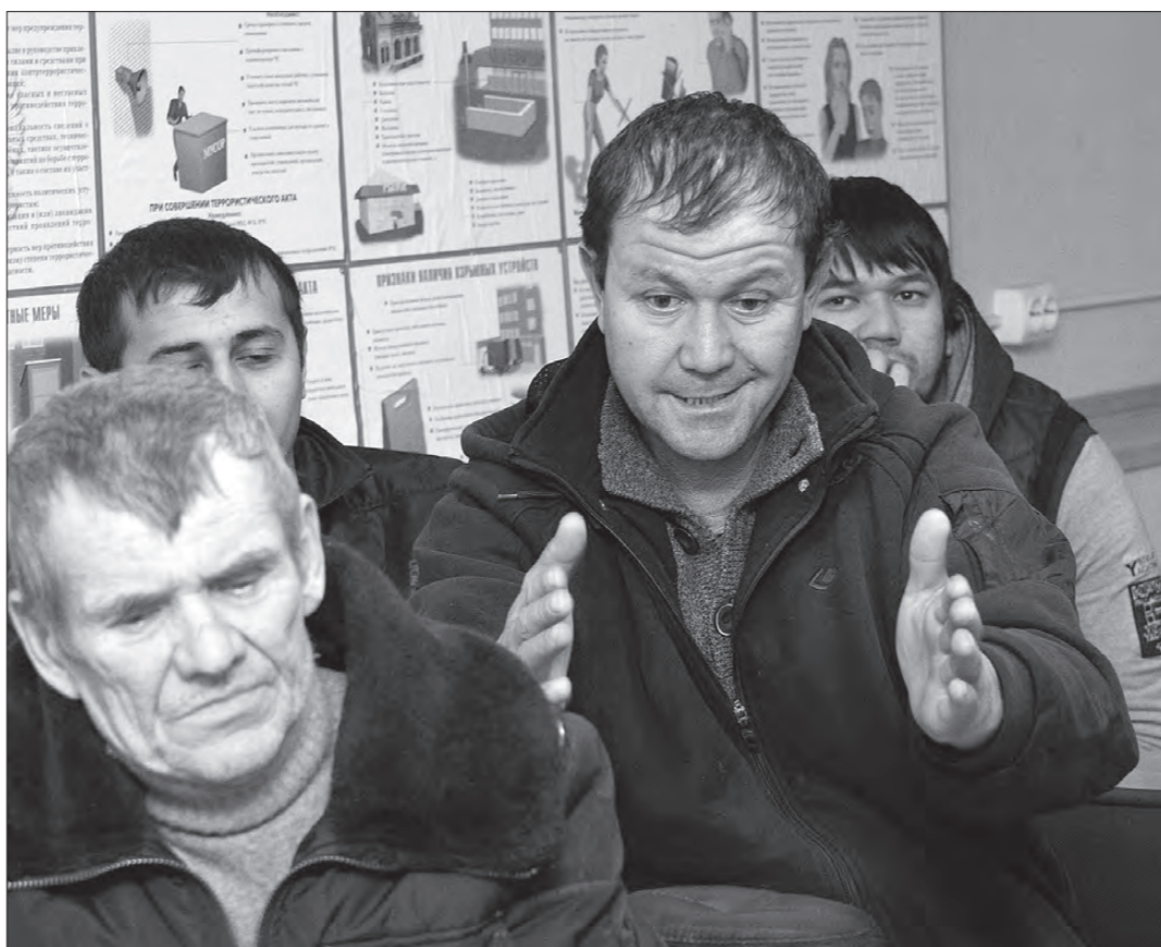
На курсах повышения квалификации.

- Все потому, что конкуренция стала выражаться во всем том, что претит безопасности, - гонках, опасных маневрах, остано-