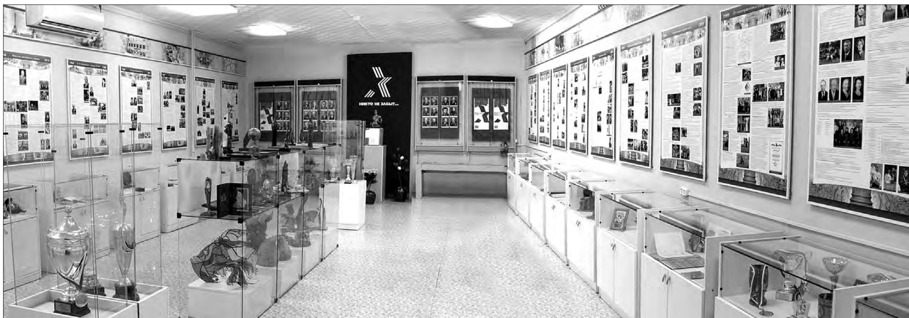
Юбилейная выставка открылась в зале истории музейного комплекса НТГСПА.

Анастасия ВАСИЛЬЕВА.