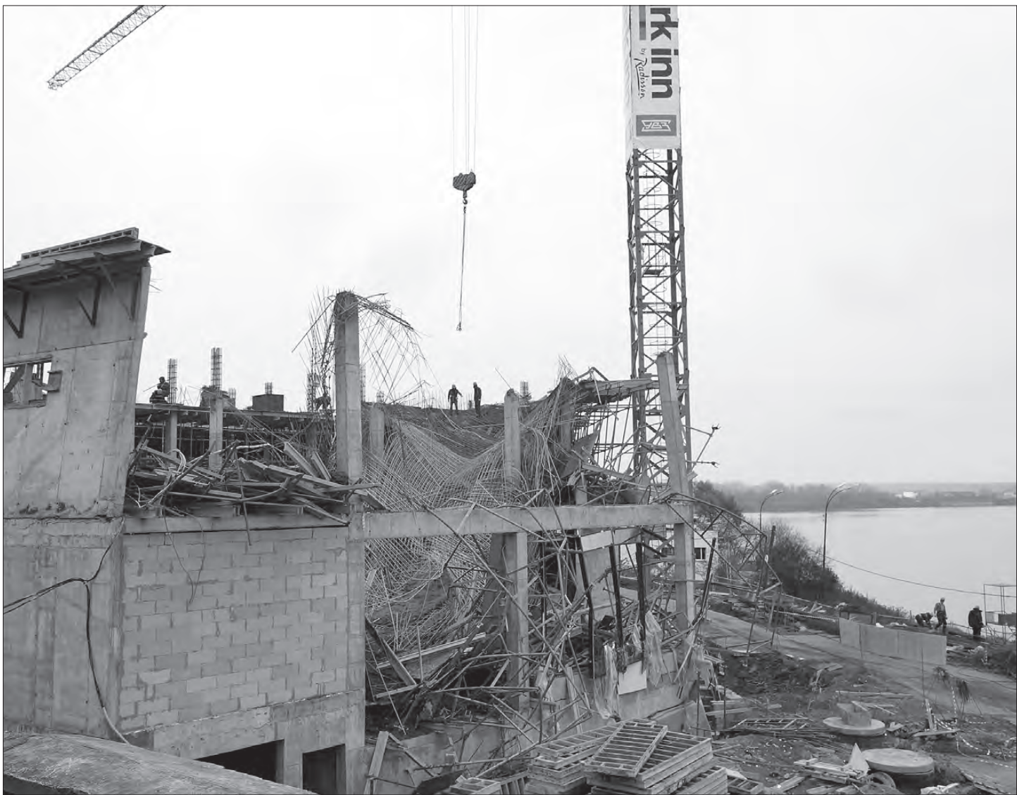
На месте ЧП разбирают завалы.