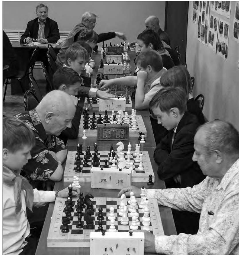
За шахматной доской – ветераны и школьники.