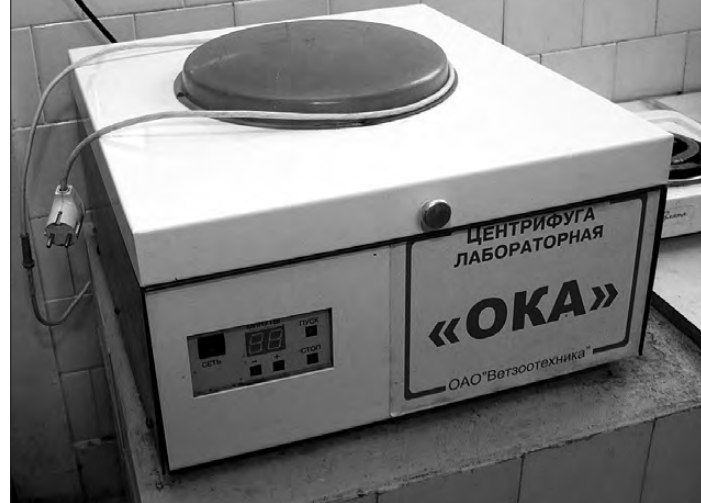
На этом аппарате определяется жирность пастеризованного молока.

О молочном цехе в Николо-Павловском хорошо знают в правительстве Свердловской области, в област-