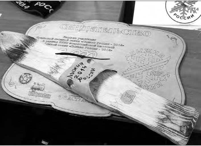
Победителям и призерам вместо традиционных медалей будут вручать изделия уральских мастеров: деревянные сувенирные лыжи и сертификаты.

таки здоровье дороже любых соревнований. На территории полигона будут дежурить три бригады «скорой» и одна – «Медицины катастроф». В самой дальней точке дистанции проконтролируют ситуа-