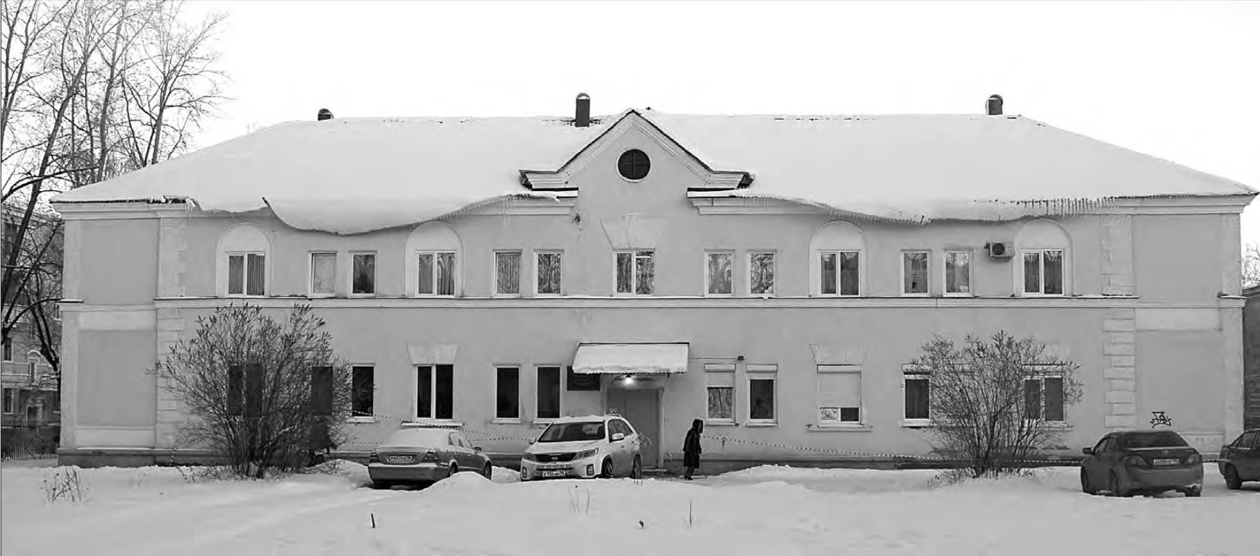
Консультационный пункт областной организации «Урал без наркотиков» пока базируется по улице Вязовской, 12.

Нижний Тагил – не столица, особого разнообразия реабилитационных услуг (да еще бесплатных!) для наркозависимых, алкоголиков не предлагается. Между тем, «наркота», «самопал» и все «прелести», с ними связанные, для промышленного города – печальная ре-