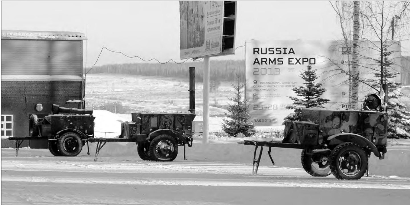
Шесть полевых кухонь уже заняли свое место на площадке и готовы к работе.