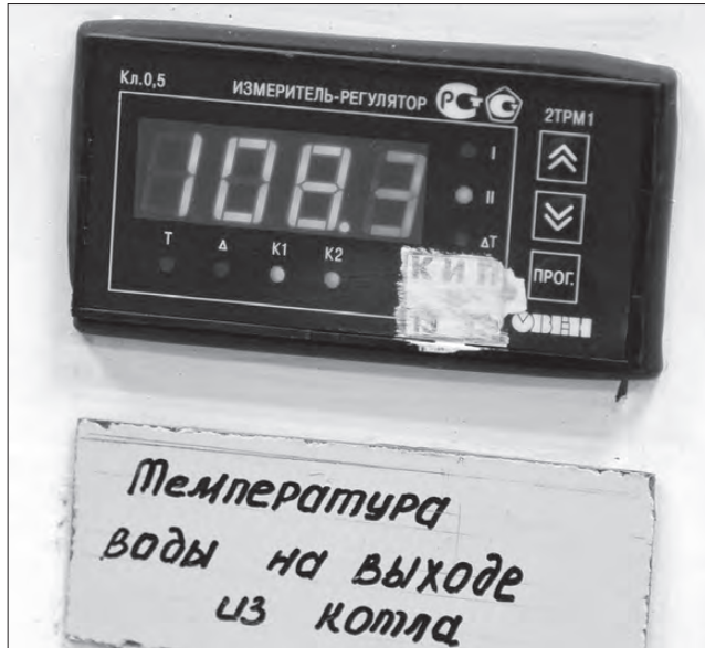
На улице было -30, давление в котлах по погоде.

От Натальи Матвеевой мы узнали, что сегодня на балансе МУП «НТТС» находится 23 котельные и 380 км тепло-трасс, в МУП «Тагилэнерго» осталось 10 котельных и 280 км теплотрасс. Но предприятия трудятся согласованно и дружно. Заняты подготовкой к летней ремонтной кам-